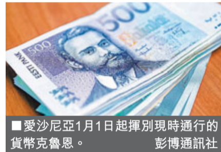
愛沙尼亞1月1日起揮別現時通行的貨幣克魯恩。

愛沙尼亞早於2004年已加入歐盟。該國中樞偏右政府堅信，像愛沙尼亞這樣小型開放的經濟體，最適合加入歐元區。