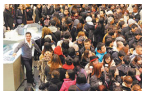
Selfridges百貨公司被塞至水洩不通，店員要護着飾櫃免被推倒。

聖誕過後，英國各大零售前日展開「拆禮物日」大特賣，由於明年1月4日起，當地銷售稅將由17.5%加至20%，因此大批民眾均把握最後機會掃貨，單在倫敦著名購物區西區便有逾50萬人到場。據報數以萬計亞洲遊客加入掃貨行列，甚至有中國旅行社組織3天英國購物團，讓內地豪客掃名牌貨。