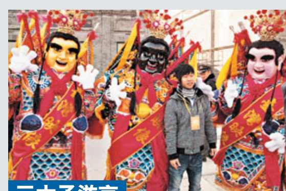
三太子遊京 北京「台灣文化商務區」27日盛裝開街，北京市政府專程請來台灣電音三太子踩街祈福。未來半個月，電音三太子還將在商務區內持續表演。中央社

今年10月至今，中國共有21個省(市、區)數百人被騙上億元。對此，中國公安部在11月底部署在北京、福建、湖北、黑龍江、四川、廣西等9個涉案地，成立電信詐騙犯罪案件專案組，全面協調開展專案偵查工作。