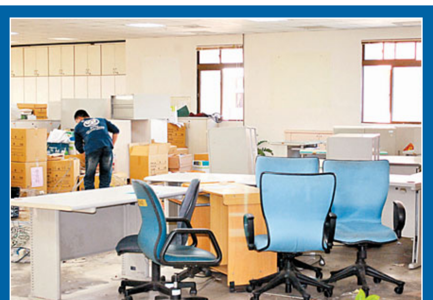
■台中縣市合併首天上班，豐原陽明大樓尚未準備就緒，4樓教育局還在清潔地面及拉網路線。

至於27鄉鎮門牌號碼，市府民政局說，將等行政區重劃之後，配合全面更新；市府初期準備了防水貼紙讓民眾張貼，如果遺失，可以洽區公所索取；另外，戶籍資料、身分證等都可以繼續沿用。