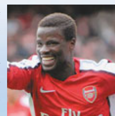
阿仙奴主帥 雲加 阿仙奴隊長 法比加斯

阿仙奴守衛伊保爾表示，今仗成功凍結杜奧巴，他們就有能力取得勝利；杜奧巴堪稱阿仙奴剋星，他13次參加對阿仙奴的比賽，一共攻入13球。「我不知道為什麼杜奧巴對我們時特別賣力，我總是問他為什麼對我們時表現如此出色，他說他自己也不知道。要對付杜奧巴，我們必須每時每刻都集中精神。要不然，他可以以任何方式入球。」伊保爾接受採訪時說。另外，雲加澄清不會借用碧咸，「已隊中場有不確特、拿斯尼、路斯基和艾沙維，伊保爾都可以擔任中場右路，人太多了。」