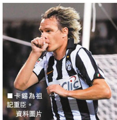
卡錫為祖國重臣。資料圖片

朗拿甸奴(細哨)1月離「意」？恐怕未必成事！AC米蘭早前成功簽入卡斯卡辛奴之後，媒體紛紛預測巴西球星細哨重投其母會甘美奧。來自巴西《環球體育》的消息，細哨本希望在冬季就返回祖國甘美奧落班，提前結束不快的意甲之旅；可是，細哨原本合約在明年6月30日屆滿，他的經理人兼哥哥，向AC索取餘下合同的8成薪水，即320萬歐元作為賠償，而AC堅持只能接受無條件和平分手的方案，否則寧願一拍兩散，等到明年夏天的自由轉會。