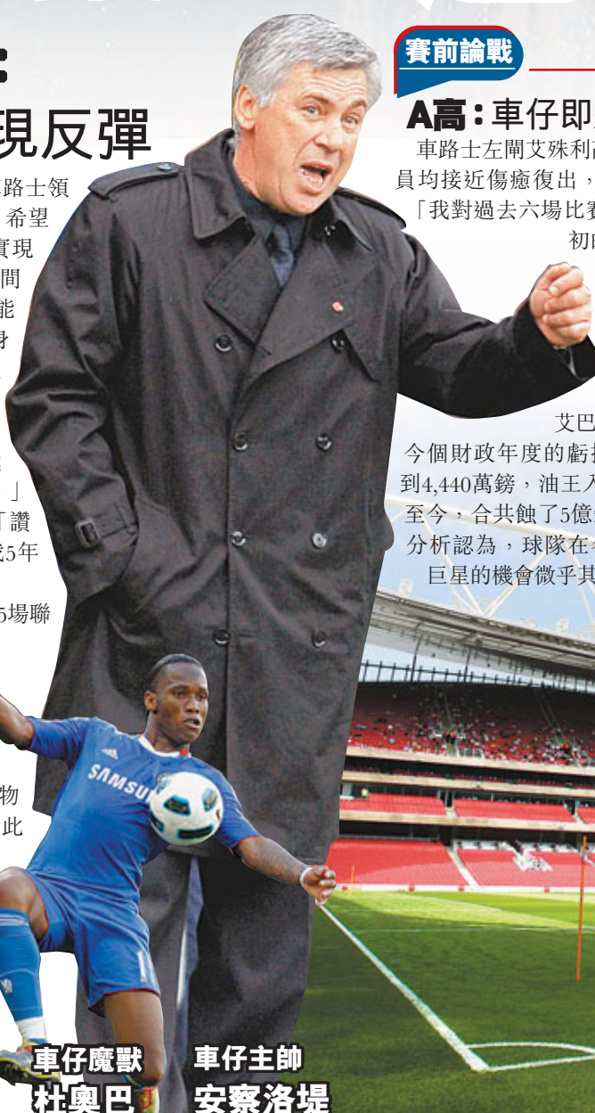
車仔魔獸 杜奧巴 車仔主帥 安察洛堤

面對雲加先出口術，車路士領隊安察洛堤亦不甘示弱，希望球隊可以在阿仙奴身上實現反彈，以結束最近一段時間的低迷，「我希望今次也能像以往一樣，在阿仙奴身上全取三分；阿仙奴的足球總是十分悅目，但他們的防線就因此暴露出漏洞，勝負的關鍵，就是我們能否把握住這些漏洞。」安帥最後更含沙射影地「讚賞」雲加表示：「如果我5年無冠軍，一早被炒了。」 這支西倫敦勁旅已連續5場聯賽不勝，狀態無疑甚差，不過上輪對曼聯的大戰因天氣問題取消，令到車仔亦有休養生息的機會。賽前消息指，球隊靈魂人物林柏特今場將復任正選。此外，翻查往績，車路士近10季造訪阿仙奴錄得3勝3和4負，勝率不算太高，但當中近6戰卻是3勝2和1負，近季作客「兵工廠」有點格格不入的味道，故今場車仔可望在酋長球場反底，重開聯賽勝門。