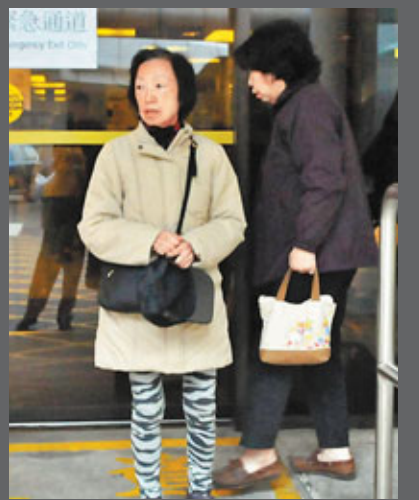
傷者妻子誓言追究索取賠償。