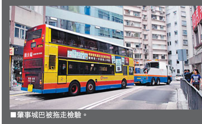
肇事城巴被拖走扣驗。