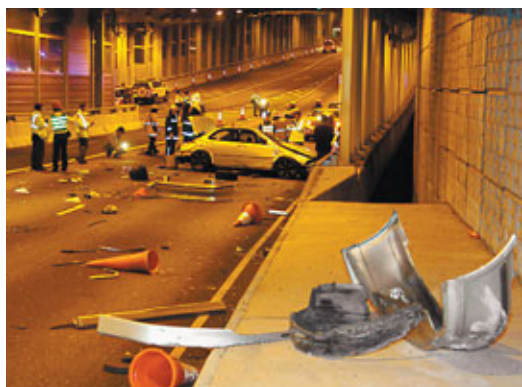
尖山隧道失事私家車頭尾毀爛不堪，現場滿佈碎片。

香港文匯報訊(記者 杜法祖)2名13歲少年，前晚10時許結伴外出慶祝平安夜，疑因所用名貴手機惹賊人垂涎。2人步至大角咀大政府與埃華街交界時，突有2名持金屬屬的青年撲出，攔途截劫。其中一少年奮起抗賊，慘被惡賊拳打腳踢及用電筒狂撲，頭部及背部受傷。兩人被劫去2部共值8,000元的手機及1,000元現金。2匪得手後逃去無蹤。2事主自行到旺角警署報案。母親稍後趕至，陪同受傷少年送院敷治。