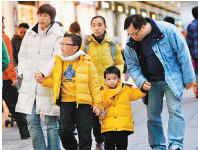
寒鋒襲港，本港昨晚氣溫跌至10℃。市民昨午外出時做好防冷措施，穿上厚衣、圍頸巾保暖。