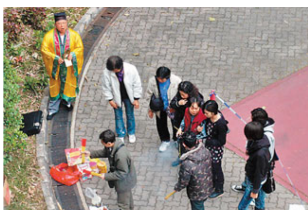
鍾母在親友扶持下到場焚香拜祭。

至昨凌晨5時12分，有途人在竹園道天馬苑駁岸閣對開籃球場發現鍾昏迷地上，經送院後證實死亡。由於鍾額頭及