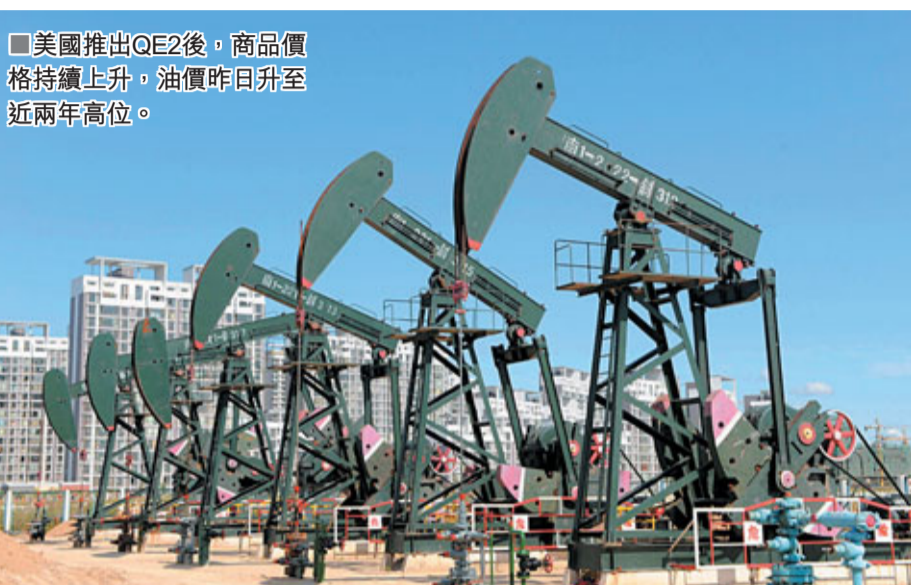
美國推出QE2後，商品價格持續上升，油價昨日升至近兩年高位。

American Energy。另外，中石化母公司中石化集團，亦尋求至少達30億美元的境外長期貸款。消息令中海油及中石化分別跌0.65%及0.81%。市場人士指出，中海油及中石化在港尋求融資45億美元，反映內地收緊信貸，令內地企業轉向海外舉債。港股方面，市場人士認為，港股交投淡靜，料短期後市將維持上落，難有突破。國指昨跌94.7點，收報12,516.5點；即日期指低水13點，成交合約8.49萬張。