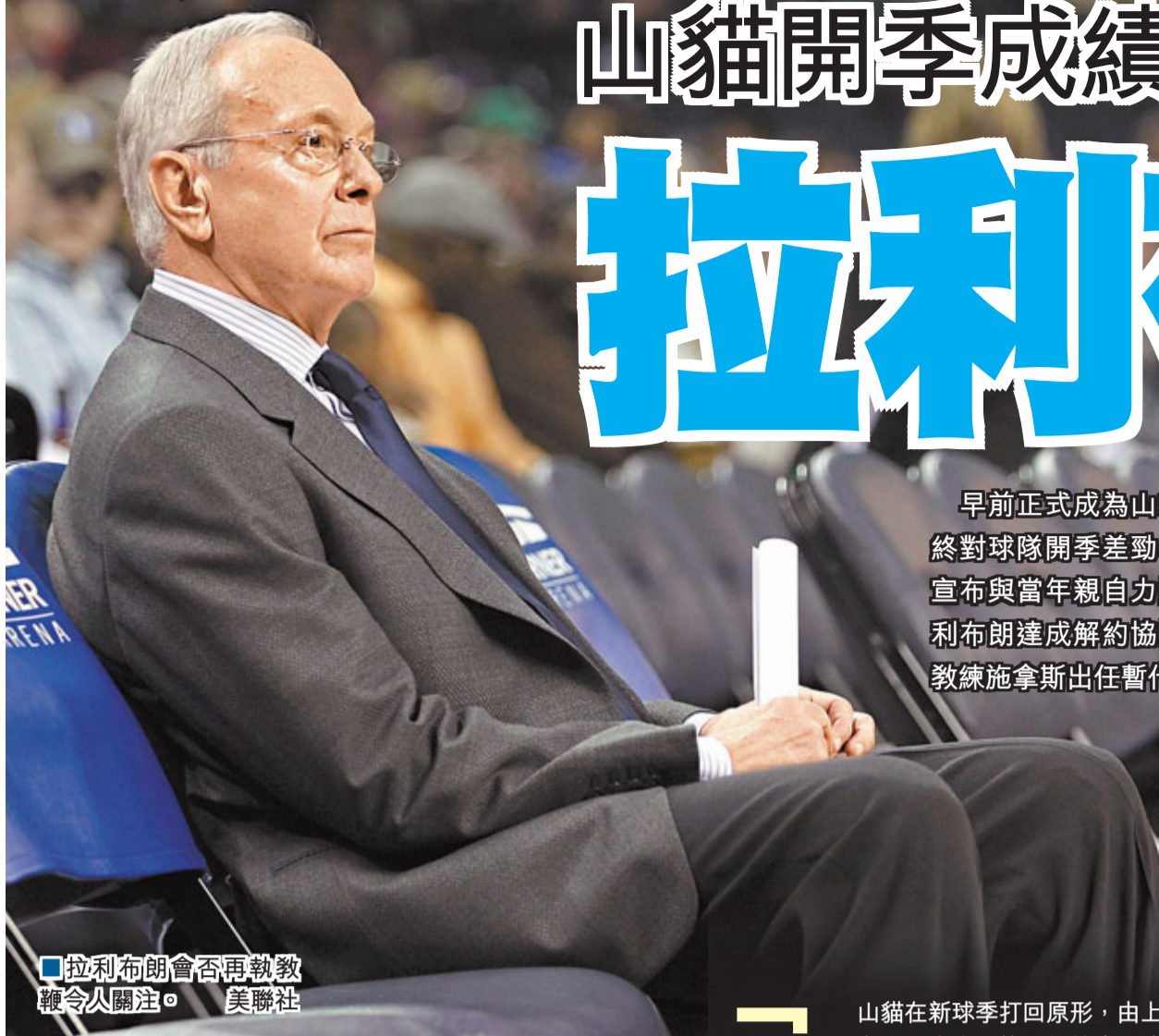
拉利布朗會否再執教鞭令人關注。