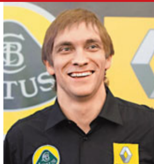
柏杜夫來季將駕駛蓮花雷諾戰車出賽。資料圖片

首位俄羅斯F1車手柏杜夫周三在莫斯科證實已與雷諾車隊續約2年。柏杜夫表示能成功續約感到高興，並準備在新賽季中減少犯錯，取得更好成績。柏杜夫今年上陣19次取得27分，在車手榜上排名第13位。2周前，蓮花成功收購雷諾F1車隊，明年的新賽季將易名為蓮花雷諾車隊，而柏杜夫在來季料續與隊友、波蘭車手古比卡拍檔出戰。