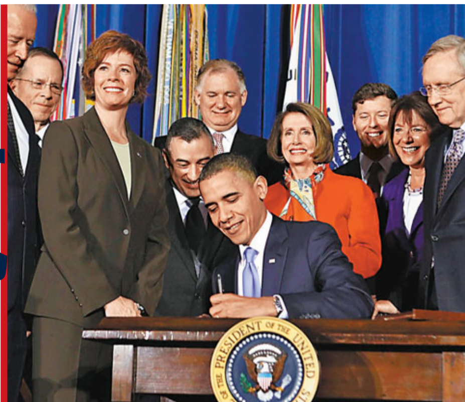
■奧巴馬在國會簽署多項法案，並表示兩黨合作成績明顯。