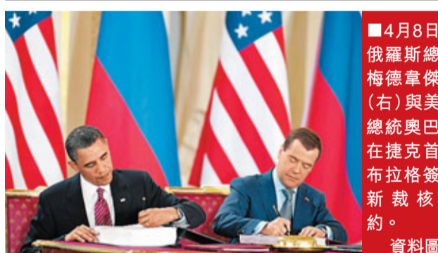
■4月8日，俄羅斯總統梅德韋傑夫(右)與美國總統奧巴馬在捷克首都布拉格簽署新裁核條約。資料圖片