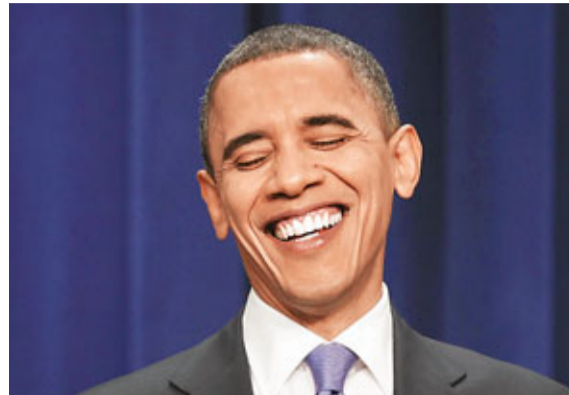
■奧巴馬宣布通過裁核條約時，笑到見牙不見眼。

然而，即使條約順利落實，美俄仍擁有足夠核攻擊力「殲滅」對方。為了安撫國內共和黨人，華府已經承諾耗資850億美元（約6,612億港元），維持未來10年的核武現代化。再者，儘管冷戰結束，但地區性衝突