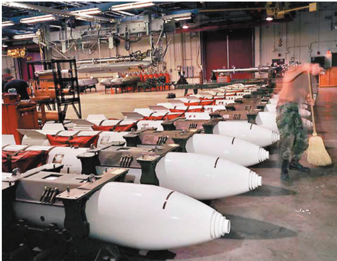
■新條約規定美俄7年內各自將核彈頭數目減至1,550枚以下。圖為美軍一個空軍基地的核彈儲存庫。

美國參議院前日批准今年4月美俄簽署的新版核裁軍條約，令未來美俄進一步削減核武器邁出重要一步，替美國總統奧巴馬開創外交政治雙贏局面，一洗民主黨中期選舉挫敗的頹風，為奧巴馬送上聖誕厚禮。奧巴馬稱，過去兩個月是美國國會「近幾十年來最具生產力的選後會期」，駁斥被指「跛腳鴨」會期的傳統觀點。