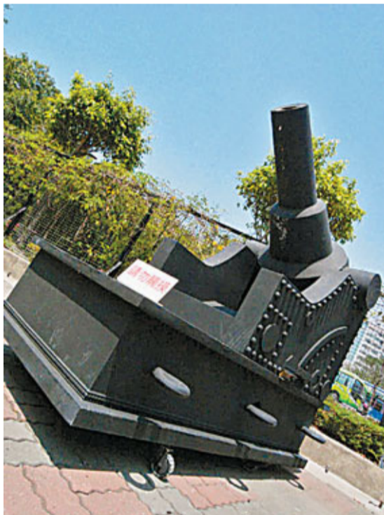
■億載金城古稱安平大砲台

大陸之間的航運要道，1865年，安平開港，正式名稱為台灣關。洋商在安平設立德記、怡記、和記、味記、東興等洋行，合稱「安平五大洋行」，興盛一時。清朝中期，安平港逐漸因淤積而不利於航行，往昔桅櫓林立的興盛景象一去不返。