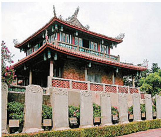
■昔日的行政中心赤嵌樓。

台南，這個台灣最古老的城市，已經和台灣其他城市一樣，呈現出模糊的面目。同樣嶄新的高樓和商廈，同樣滿街的錦羊電車。但走向台南的西面，直至滄海桑田處——安平古城。那些到此尋找古早風的遊客和熙來攘往的商舖，似乎為那些古街窄巷曾經繁榮過作出一個證據。安平曾經是台灣的重要貿易港口，它擁有台灣第一條商業街，也曾經因為港口泥沙淤積而逐漸沒落成一個小漁港。