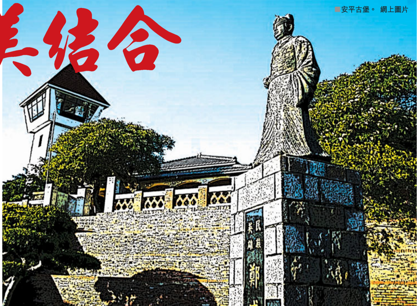
■安平古堡。

走在延平街上，安平的古老傳統房屋體積細小，門窗低矮。有人說可能是因為靠海為生的漁民貧窮所致，也有人說是因為要防海風吹襲，更有一個傳說是安平漁民習慣了船上的細小構造，所以即使是住在陸地上，也無法適應空曠住處。在台南安平區的房屋，不難發現門外均貼上各種桃符或者一些圖騰和辟邪之物。在台南，這些東西叫做「厭勝物」。傳說是因為安平房屋格局矮小逼仄而居民眾多，巷弄縱