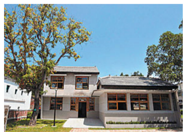
■書法家朱致聖故居