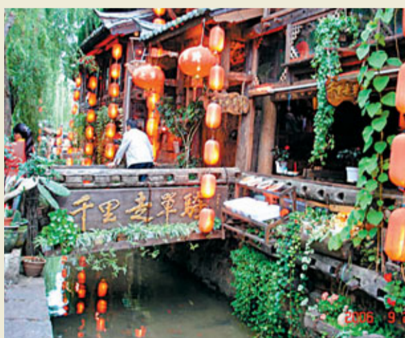
■麗江古城的酒吧「千里走單騎」。

我和老伴兒放慢了腳步，還不時停下來做一番咫尺的感受。在麗江古城的酒吧，你可以喝上幾千元的雞尾酒，也可以端着一杯礦泉水或者一瓶啤酒慢慢享受。