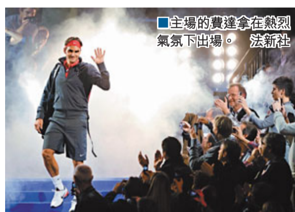
主場的費達拿在熱烈氣氛下出場。

在瑞士進行的這場比賽所籌資金將納入費達拿基金會，用於幫助非洲兒童接受教育。目前該基金會主要惠及埃塞俄比亞、馬拉維、坦桑尼亞、津巴布韋和南非等地。作為「回報」，費達拿還將於22日在「納豆」的主場西班牙再次