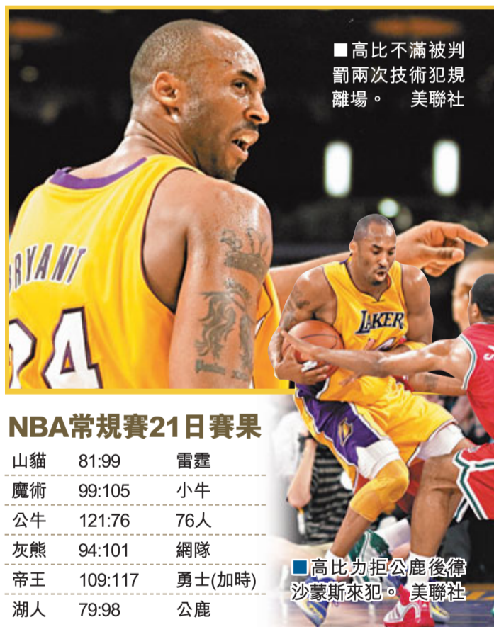
高比不滿被判罰兩次技術犯規離場。

雖然有三名隊員因傷缺陣，但密爾沃基公鹿隊21日在NBA常規賽中依靠替補陣容，以98:79擊敗衛冕冠軍洛杉磯湖人隊；夏洛特山貓隊在主场迎戰俄克拉荷馬雷霆隊比賽中，末節投籃命中率急劇下降，以81:99告負。