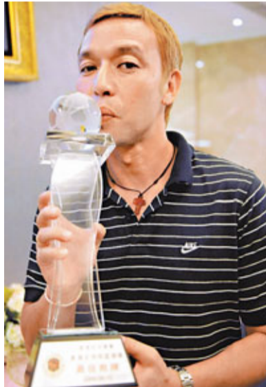
山度士不但是傑出球星，而且在09年當選最佳教練。