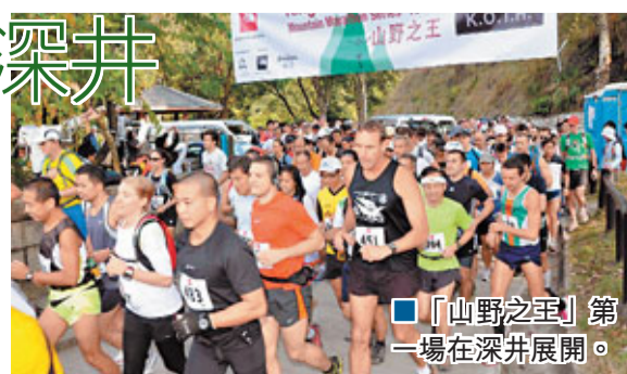
「山野之王」第一場在深井展開。

比賽的整體成績才可揭曉。餘下賽事日期和路段如下：2011年1月9日大嶼山；2011年2月13日港島山徑；2011年3月6日西貢山徑。