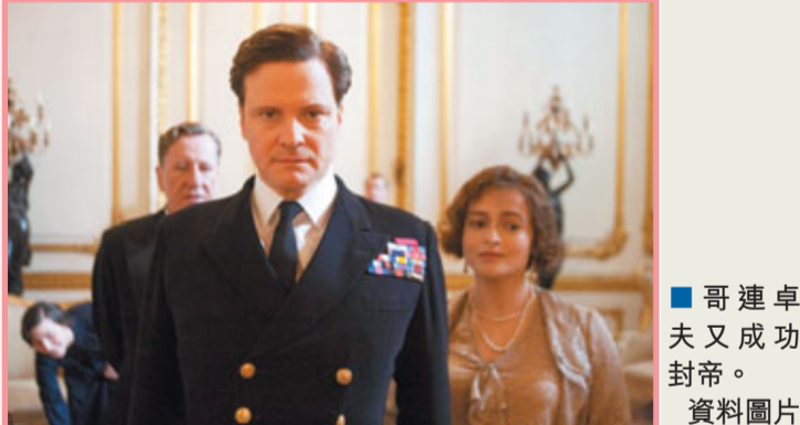
哥連卓夫又成功封帝。 資料圖片

上週日剛公佈提名名單的芝加哥影評人協會(Chicago Film Critics Association Awards, 簡稱「CFCAA」), 於昨日正式公佈獲獎名單, 講述facebook創辦人朱克伯格的《社交網絡》(The Social Network)在8項提名中, 成功奪得最佳影片、最佳導演及最佳改編劇本3個獎項, 成為當晚的大贏家。