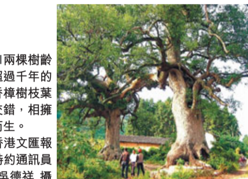
兩棵樹齡超過千年的香樟樹枝葉交錯,相擁而生。

香港文匯報訊(記者 盧麗寬、特約通訊員 吳德祥 龍岩報道)龍岩連城縣北園鎮山下村有對被稱作「千年夫妻樹」的香樟樹。據村民介紹,該樹樹齡至少有一千年以上,是目前發現的連城最大的香樟樹。由於兩個老樹相距僅6米,大小相近,樹上的樹枝長在了一起,像似一對情人手拉着手。