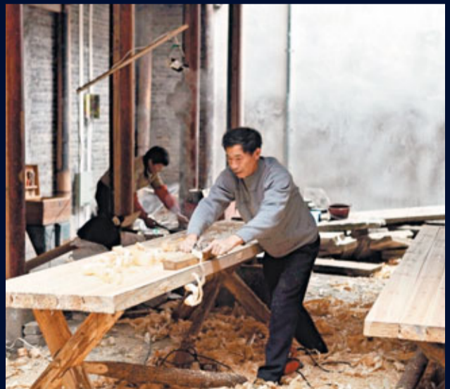
■由於政府啟動「百村千幢」工程，大批本地工匠紛紛回流。圖為一名工匠使用傳統工具為木料刨光。

「百村千幢」工程實施以來，黃山地方政府不僅挽救了一大批古村落、古民居，還用自有資金撬動了社會資本。現在，農民們忙着修繕舊居，以改善居住條件；商人們忙着覓求好房，來開展經營。很多原本破落的古民居，開始受到關注和修繕。那些被遺棄的建築構件，現在都派上了用場，找到了最合適的歸宿。同樣，修復古民居需要傳統的工匠，黃山並不少能工巧匠，但過去大都都在外地，或改行或打工。現在，這些工匠們也開始回流了——因為家鄉古民居的修復需要他們。特別是，手藝上佳的木匠、雕工師傅，在外打工一天可能只掙一兩百元，回來卻能掙到兩三百元，木雕的工價更是水漲船高。