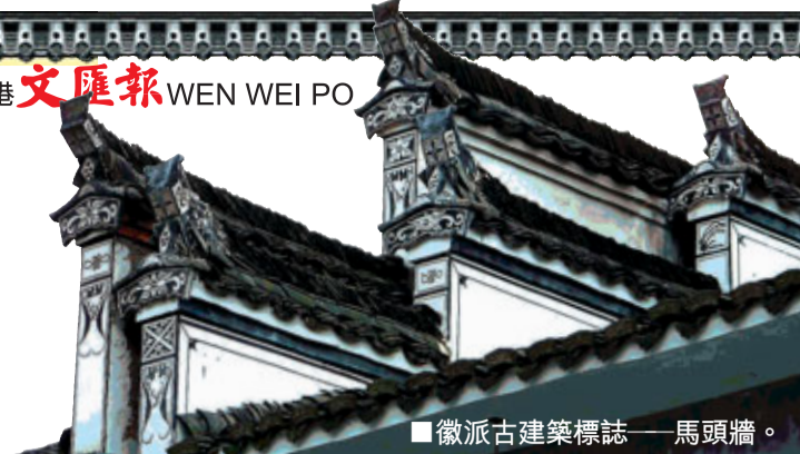
徽派古建築標誌——馬頭牆。