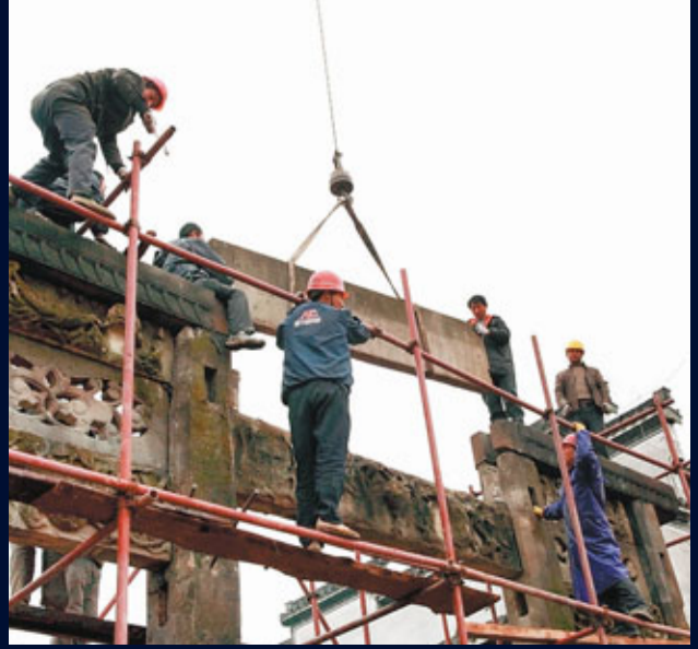
■工人正在湖邊古村落吊裝「世科坊」牌坊。