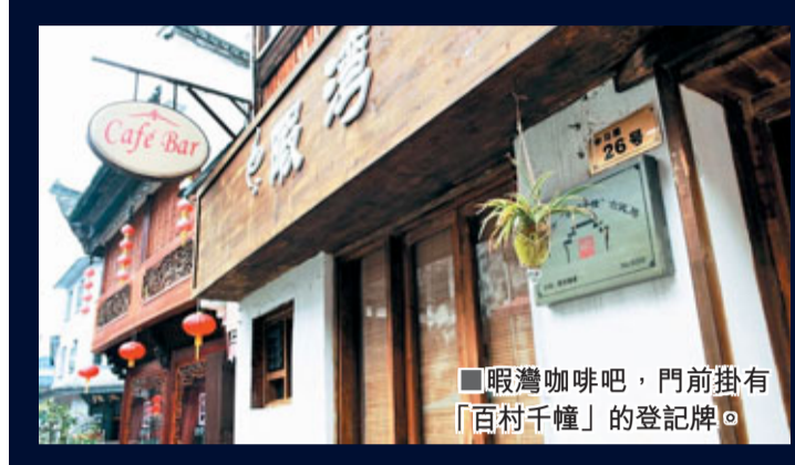
■暇灣咖啡吧，門前掛有「百村千幢」的登記牌。

徽商故里——徽州是一個峰巒重疊、煙雲繚繞的山區，歷史上地少人稠的商賈之鄉。古徽州地區文化鼎盛一時。生於斯長於斯的徽商，「買而好儒」、在中國商界稱雄明清數百年，出現了「無徽不成鎮」的盛況。