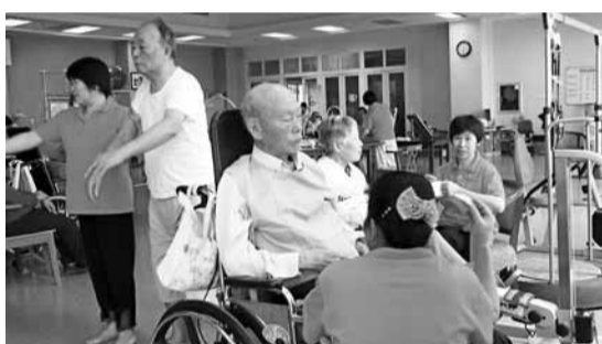
老年人口的迅速增加,對中國的社會保險、醫療保障及社會倫理等方面都提出了嚴峻的挑戰。圖為位於珠三角的一家養老院。

從今年秋季學期開始,國家還上調了助學金資助標準,由2,000元上調到3,000元。袁貴仁表示,根據國家經濟發展水平和財力狀況,將建立國家獎助學金標準動態調整機制,今後獎助學金將會隨政府財力狀況動態調整,滿足家庭經濟困難學生基本生活和學習需要。同時,國家將不斷擴大中等職業教育免費範圍,提高農村家庭經濟困難寄宿生生活標準,同時要大力推進生源地信用助學貸款工作,保障教育公平。