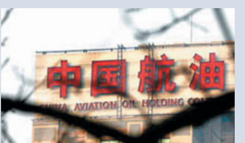
■04年，中航油(新加坡)公司原高管炒期貨指數，造成5.54億美元的國有資產虧損。

據與會者透露，學員班最終思考的焦點聚集在四個課題上，分別是：跨國經營與資源整合，改進政府管束與政策支持，國際化經營與風險監控，「走出去」戰略國際化人才支持。對於央企普遍面臨的海外資源整合難題，結論是多數失敗案在經營策略上盲目自大，對自身及收購資產認識不足，導致即使買下來，也不懂怎麼經營。而在國際化經