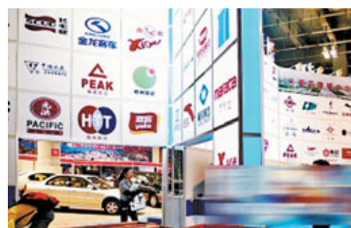
■央企亦會在內地城市為海外公司招聘。

並盡快出臺新的《境外投資條例》。據悉，條例的一個核心內容，是將境外投資資金的審批權限再擴大十倍。