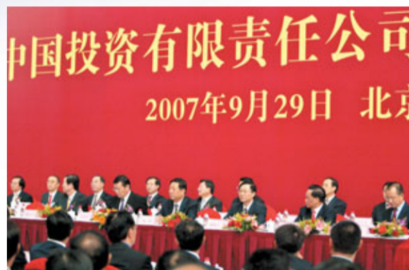
■中國主權財富基金中投公司，在全球招聘高管。

其實早在2003年國資委剛成立時，首任國資委主任李榮融便意識到問題的嚴重性，並試圖