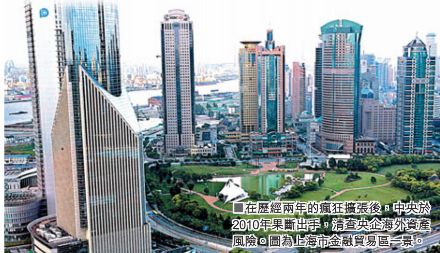
■在歷經兩年的瘋狂擴張後，中央於2010年果斷出手，清查央企海外資產風險。圖為上海市金融貿易區一景。