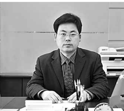
井店鎮鎮長李洪魁

近年來,井店鎮堅持以科學發展觀為指導,統籌城鄉一體化發展,逐步實現農民和農村居住小區化、就業非農化、服務社區化、生活城市化、生產園區化的目標,走出一條又好又快的發展道路。