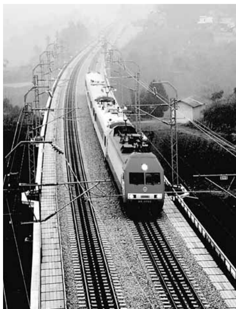
■中國建設難度最大的山區鐵路——位於湖北恩施土家族苗族自治州的宜萬鐵路，將於22日舉行正式通車儀式。圖為19日，一輛檢測車行駛在宜萬鐵路上。

據新華社20日電 中國人民大學經濟研究所的一項調查研究顯示，在區域規劃和產業加速梯度轉移的作用下，中西部持續的高速增長彌補了東部經濟增長乏力的缺口，中國經濟的重心開始向中西部轉移，經濟增長極的多元化時代正在到來。