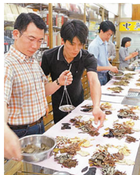
兩岸醫衛協議簽署後，預料大陸中藥材進台將進一步收緊把關。

不只源頭管理，若大陸進口中藥材檢出有毒物質，兩岸除需相互通報，該藥材不得再進口，直至改善為止。中醫藥委員會指出，對岸官方還需負責督導後續賠償事宜。黃林焯指出，目前只訂89種中藥材查驗標準，簽署協議後，12月底雙方還會進一步討論是否增加其他中藥材進口項目及檢驗標準調整。