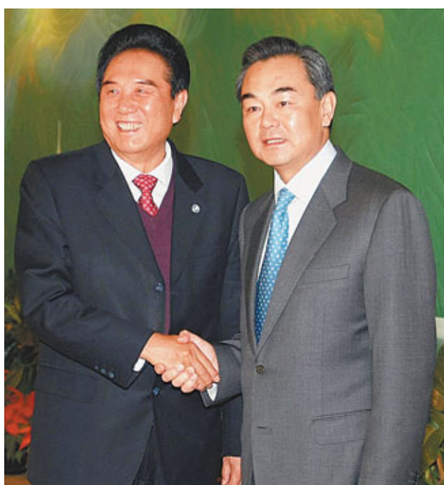
國台辦主任王毅(右)在北京首都機場為陳雲林送行。

王毅說，兩岸現在是大交流的局面，很多事務要通過兩岸兩會來協商和溝通，兩會要做的事情非常多，下一步如何運作，兩會將認真協商。總的來講，兩會協商要適應兩岸大交流、大合作的新局面，更好地發揮功能。