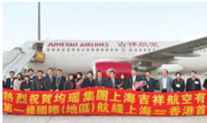
兩家民營航空將上海至香港航線的價格戰推向空前激烈。圖為吉祥航空的港滬航線早前開通時攝。

香港文匯報訊(實習記者 錢修遠 上海報導)即將聖誕，吉祥航空宣布，將於本月17日開通滬港每日往返直達航線，往返最低票價確定為900元，全力搶佔聖誕節市場。此外，春秋航空也已實行299元、430元的超低票價策略，兩家民營航空將上海至香港航線的價格戰推向空前激烈。