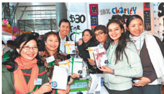
教育局候任常任秘書長謝潔潔(左二)、匯豐銀行香港區總裁馬凱博(左三)及國際成就計劃香港部行政總裁劉少坤(左一)到學生公司購物。

香港文匯報訊「學生營商體驗計劃」是全港最大的青年企業教育課程，今年參與學生的人數更創新高。昨天超過1,800個高中學生成立了75間學生公司，在一年一度於中環匯豐總行大廈地面廣場舉行的展銷會上，推售過百款創意產品，盡展企業精神、團隊合作及領袖才能。