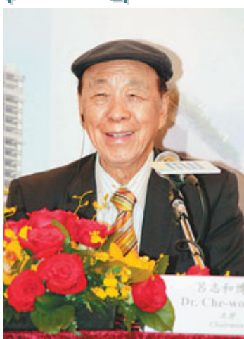
呂志和今到上海開會及考察，趁機與兒孫一起到杭州玩玩。

香港文匯報訊(記者 梁悅琴、李永青、周穎)一年一度的聖誕節即將來臨，不少財經名人都趁機會一嘍，出外玩玩，或安排特別節目鬆馳一下緊繃的神經。嘉華集團主席兼創辦人呂志和會帶兒孫到上海坐高鐵，新地副主席兼總經理郭炳江則打算在家「打邊爐」，泛海執行董事關堡林亦計劃與家人留港同度聖誕節及農曆新年，以實際行動支持香港消費。