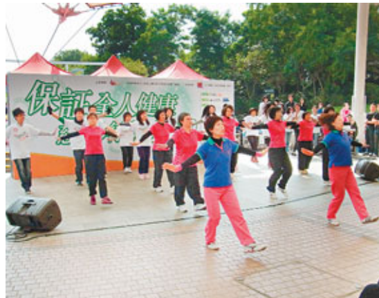
步行籌款前，一班身穿粉紅套裝的女士帶頭大跳健康舞操熱身。

香港文匯報訊(記者 余美玉)由香港人壽保險從業員協會舉辦的「保證全人健康慈善步行籌款2010」活動，因颶風及天雨關係，由10月延期至昨日於大埔海濱公園舉行，參與者除一班保險從業員外，立法會保險界議員陳健波擔任主禮嘉賓之一。