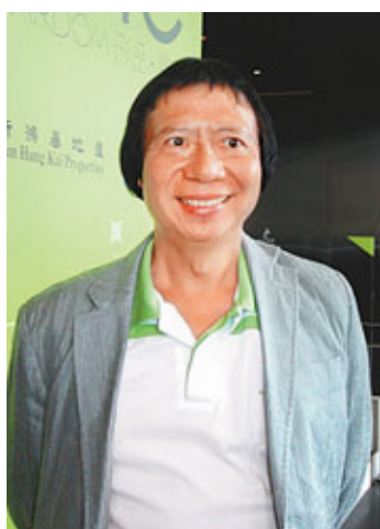
郭炳江透露，打算在家「打邊爐」度聖誕。