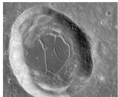
圖為由嫦娥二號衛星CCD立體相機拍攝的丹聶耳撞擊坑圖像。

11月8日，中國國家國防科技工業局首次公布嫦娥二號衛星傳回的月球虹灣區域局部影像圖。