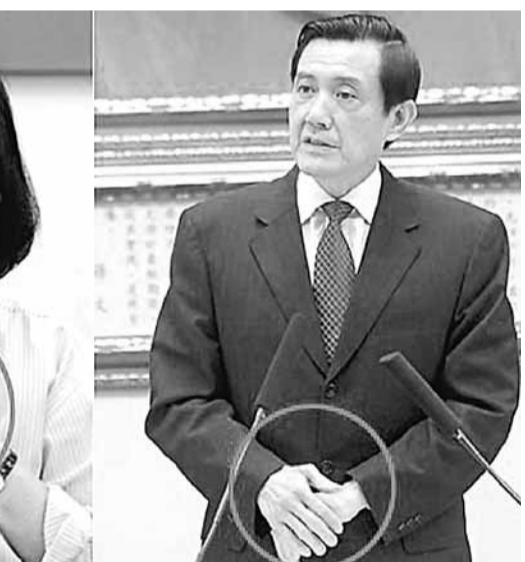
■喬納瓦羅分析發現，馬英九緊張時有揉手指的習慣動作(右)，蔡英文說話時會不時摸著胸口。

來形容蔡英文，這在美國是指偏向「技術官僚」的政治人物。他認為，蔡英文看起來雖然不是充滿活力的人，但對於她所表達的意思，倒是非常完整。