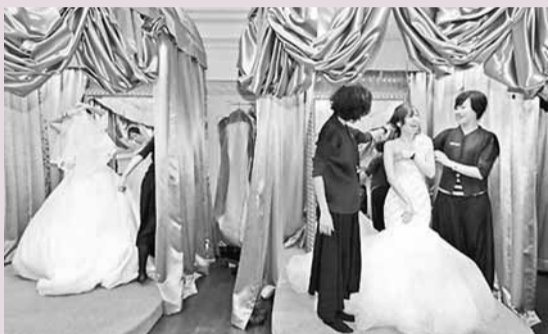
■「百年」結婚潮到，婚紗業者業績佳，婚紗試衣間內，新人們在業者的協助下試穿婚紗禮服。

但好年好日結婚，代價也要多付出一點；婚宴訂席訂單接到明年11月底的台北國賓飯店表示，以婚宴專案專案廳起桌價為17,800元起比較，約較今年婚宴費用略漲800元，漲幅約4%；台北遠東飯店下年的婚宴費用則較今年每桌約增500元左右。雖然貴，喜宴訂席率依舊熱滾滾。