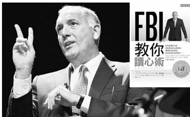
■喬納瓦羅曾在美國聯邦調查局(FBI)「反情報及行為部門」擔任主管達25年，亦有撰書(見小圖)分享「讀心」心得。