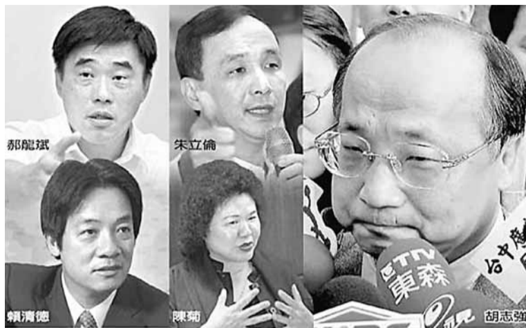
■根據「讀心術大師」喬納瓦羅的分析：郝龍斌常嘗試爭取認同，朱立倫的反應和情緒一致，胡志強喜歡讓對方感到親近，賴清德是最好的危機處理發言人，陳菊擅長控制群眾情緒。

在喬納瓦羅眼中，陳菊善於用誇張的技巧激勵並拉高群眾情緒，在冷靜壓低群眾的反應後，她會再繼續鼓舞群眾一波更高漲的情緒。喬氏說，雖然陳菊會「無意識地玩弄她自己的手指，來安撫她的緊張」，但她的手勢常常表現她的關心。另外，當陳菊「摸著胸口並視線朝下看」時，表示她正在談論心中很重視的事情。