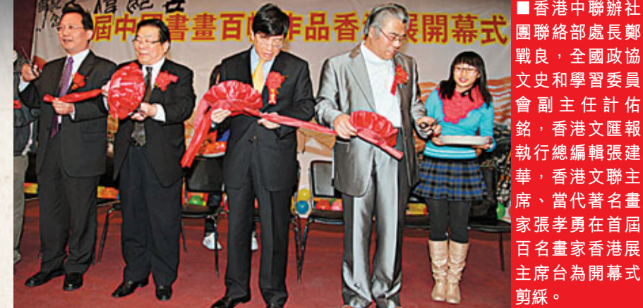
香港中聯辦社團聯絡部處長鄭戰良，全國政協文史和學習委員會副主任計佑銘，香港文匯報執行總編輯張建華，香港文聯主席、當代著名畫家張孝勇在首屆百名畫家香港展主席台為開幕式剪綵。