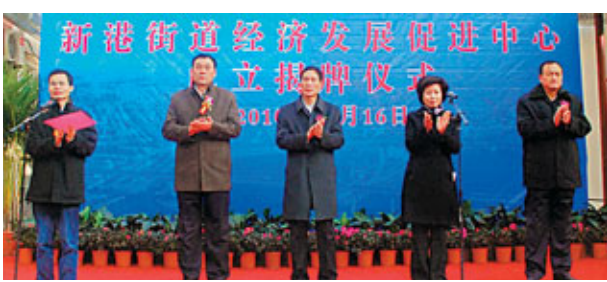
■新港街道經濟發展促進中心成立揭牌儀式

【香港文匯報訊】（記者 張越 天津報導）12月16日，濱海新區面積最大、功能最全、設施最完備的街道經濟發展促進中心在新港街成立。作為先試先行的街道經濟服務中心將在濱海新區塘沽各街道逐漸推廣。