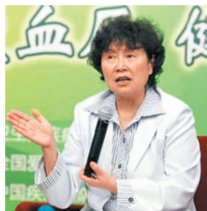
■楊功煥表示，二手煙的危害如果不及早防治，將會帶來更重的醫療負擔。資料圖片

據北京晨報19日報導 中國疾病預防控制中心副主任、控煙辦公室主任楊功煥日前在一個媒體論壇上透露，最新統計，二手煙受害者達7.4億。而2007年公布的數據中，這一數字還是5.4億。 根據世界衛生組織《煙草控制框架公約》要求，自2011年1月起，我國應當在所有室內公共場所、室內工作場所、公共交通工具和其他可能的室外公共場所完全禁止吸煙。但3年二手煙受害者卻增加了2億人。由此可見，中國控煙工作任重道遠而又責無旁貸。 某公益論壇日前就二手煙問題召開研討會，主持人手中的數據顯示，2007年中國擁有煙民3.6億，二手煙民為5.4億。與會的國家控煙辦公室主任楊功煥女士立刻糾正說，依據今年8月公佈的最新數據，中國遭受二手煙危害的人數已達7.4億人。她表示，二手煙的危害如果不及早防治，將會帶來更重的醫療負擔。