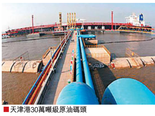
■天津港30萬噸級原油碼頭

天津港30萬噸級原油碼頭位於天津港南疆港區東端北側，總投資13.79億元，是天津百萬噸乙烯項目主要配套工程。碼頭可滿足30萬噸級郵輪進港，設計年通貨能力2000萬噸，於2008年8月29日投入試運行。該碼頭代表着一個港口接卸能力的標準，提升了天津港的綜合競爭力。截至目前，該原油碼頭已接卸郵輪146艘次，累計完成吞吐量2078萬噸。天津港集團也將以這次通過國家驗收為契機，不斷加大碼頭的設備設施建設，使其盡快達到年接卸1600萬噸的目標。