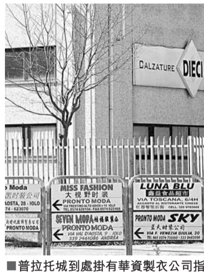
普拉托城到處掛有華資製衣公司指示牌。