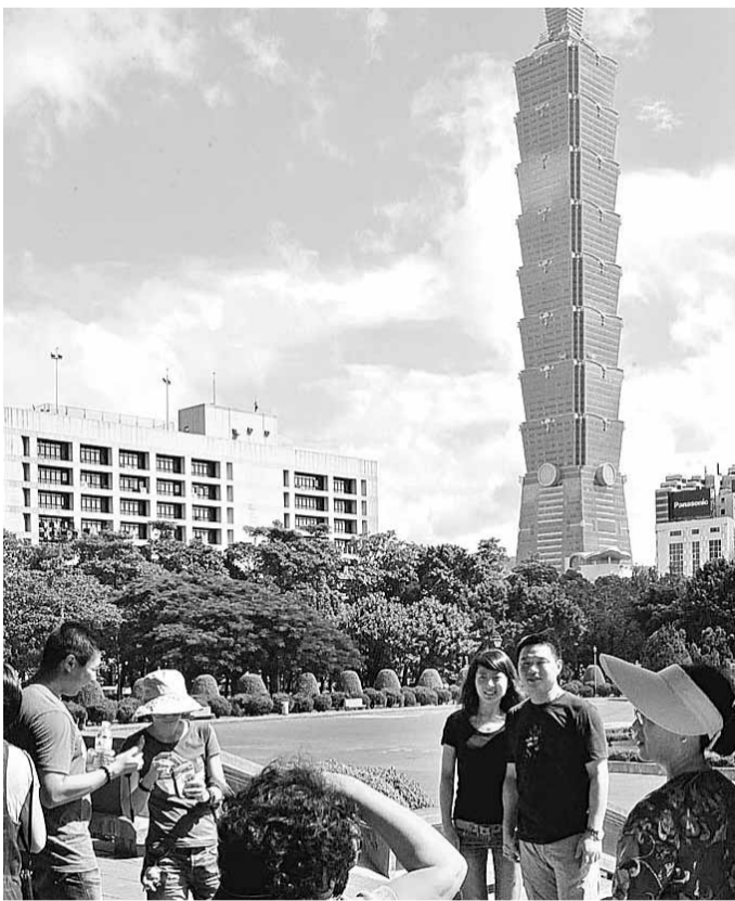
陸客赴台人次上限下年將由每天3000提高至4000。圖為大陸旅客在台北地標101大樓前拍照留念。資料圖片

另據《聯合晚報》報導，陸委會主委賴幸媛與海協會長陳雲林的會面，將選在內湖地區的一家飯店舉行。21日上午舉行江陳會談，就過去協議執行情況與未來將協商的議題進行討論，下午進行正式簽署儀式，簽署「兩岸醫藥衛生合作協議」，隨後海協會與海基會舉行中外記者會。記者會後陳雲林將驅車前往內湖，與陸委會主委賴幸媛會面，晚間由海協會答謝宴請海基會。