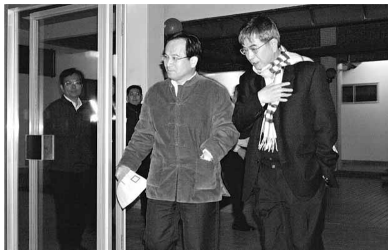
台南縣長蘇煥智(左)涉及索賄，17日晚接受檢方2個小時偵訊後被請回。

據中通社18日電 台南地檢署偵辦台南科學園區土地開發弊案，17日以被告身份約談台南縣長蘇煥智並搜查其官邸、辦公室，蘇煥智強烈批評檢方是「政治迫害」，並揚言18日到南檢絕食靜坐抗議；台南地檢署18日對此發表聲明，強調真相只有黑白，沒有藍綠，希望當事人不要有過激反應。