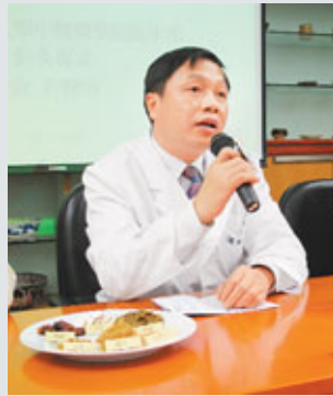
■倫新醫師表示，天灸療法對哮喘、胃病及類風濕性關節炎等效果最佳。

香港文匯報訊（記者 譚靜雯）哮喘、鼻敏感等港人常見的慢性疾病，經常於秋冬期間發作，浸會大學發現，利用中醫天灸治療，療效更佳。浸會大學中醫藥診所今年成功訪問281名患有鼻敏感或哮喘患者，約60%受訪者接受天灸治療後，症狀有明顯或輕微改善，例如轉季的復發機會大減。