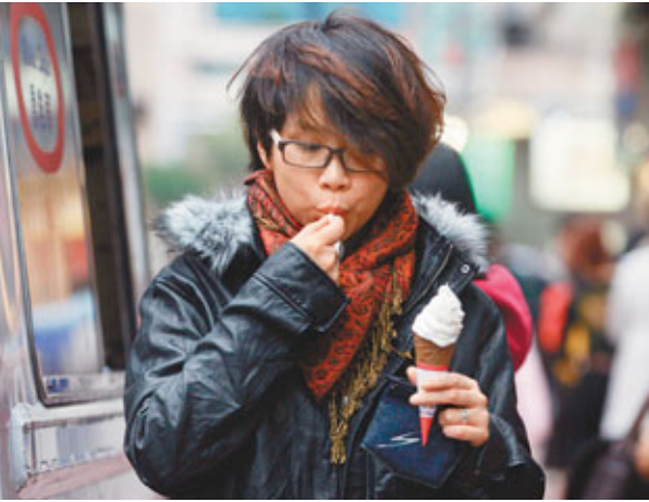
■冬衣緊裹、手持雪糕—外冷內熱型格。

民政事務總署昨日開放14間臨時避寒中心，有430人入住。長者安居服務協會由昨日凌晨至清晨6時，收到93人次按動平安鐘，當中14人送院，主要因痛症或嘔吐。