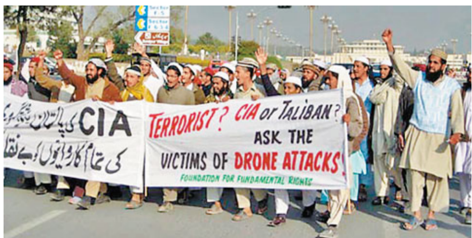
■巴基斯坦民眾早前示威，抗議美國的無人機濫殺無辜。

美國中央情報局 (CIA) 駐巴基斯坦情報主管因身份暴露被召回國，令奧巴馬政府打擊「基地」組織的反恐行動再遭挫折。這名主管據稱已於上週四啟程回國，礙於身份特殊，其姓名、公開職務等詳情未被公開。有美國官員懷疑是巴國情報機關故意「放料」，凸顯美巴反恐盟友的互不信任。