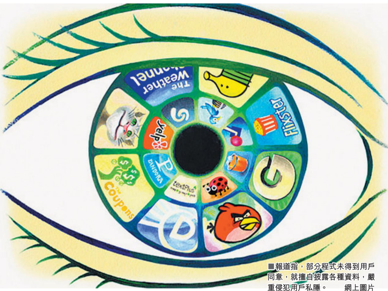
■報章指，部分程式未得到用戶同意，就擅自披露各種資料，嚴重侵犯用戶私隱。

不過，至少有4家程式商在接到《華爾街日報》查詢後貼出私隱政策，包括製作大熱遊戲Angry Birds (憤怒鳥)的芬蘭公司。儘管用戶個人私隱受侵犯，但他們可謂束手無策。因為智能手機和個人電腦不相同，電腦用戶可把儲存瀏覽紀錄的Cookies檔案刪除，保護個人資料，但手機用戶卻不能選擇不被追蹤。