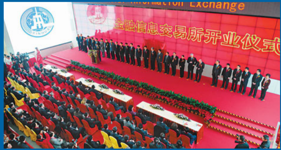
■新華社金融信息交易所開業儀式在北京市麗澤金融商務區舉行,這是全球金融信息領域首創的交易所。