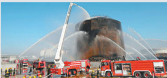
■浙江平湖一萬立方米丙烯罐起火,明火熄滅後,救援人員繼續向儲罐噴水防止復燃。

據中通訊社18日電:昨日上午,位於浙江省平湖市全塘鎮華辰能源油庫一萬立方米丙烯罐爆炸起火。上海、浙江兩地消防部門緊急出動前往火災地點搶險。