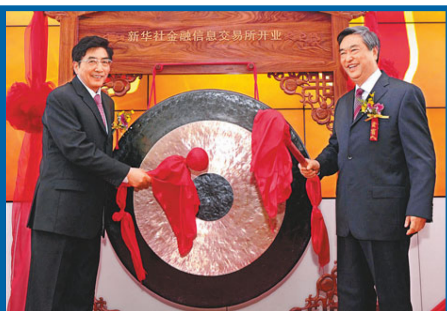
■新華通訊社社長李從軍(右)和北京市市長郭金龍(左)共同為新華社金融信息交易所開鑼。

新華社金融信息交易所位於北京市麗澤金融商務區,交易所根據交易產品「標準化、產品化、可交易化」的原則,首批上線全國銀行理財產品發佈交易、全國無線增值服務產品發佈交易、全國專利技術轉讓項目交易等業務。交易所採用公司制的組織形式,結合了公司制和會員制交易所的優勢,創新性建立了獨立的會員體系,目前已有全國主要金融機構、大中型企業、資本要素市場會員近300家。