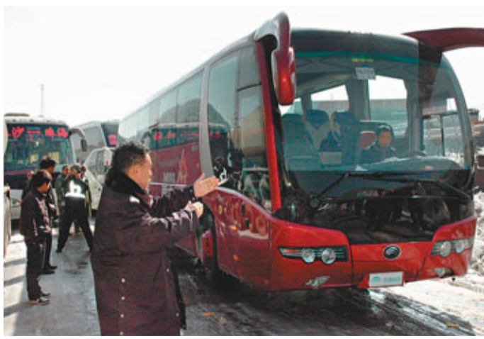
■京港高速恢復通車。

受寒潮影響,京港高速粵北路段出現結冰,導致交通一度擁堵。17號下午3點京港高速交通恢復正常,車輛疏散完畢。供港蔬菜量恢復正常水平,價格有望回落。