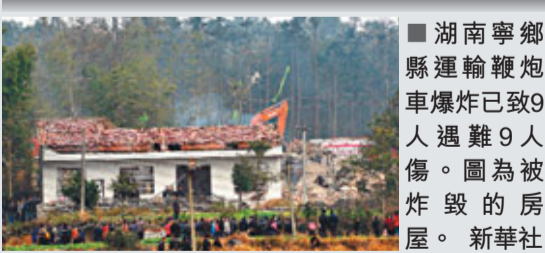
■湖南寧鄉縣運輸鞭炮車爆炸已致9人遇難9人傷。圖為被炸毀的房屋。