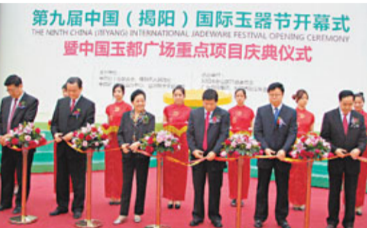
第九屆中國(揭陽)國際玉器節開幕式。圖為揭陽市東山區中國玉器廣場隆重舉行。