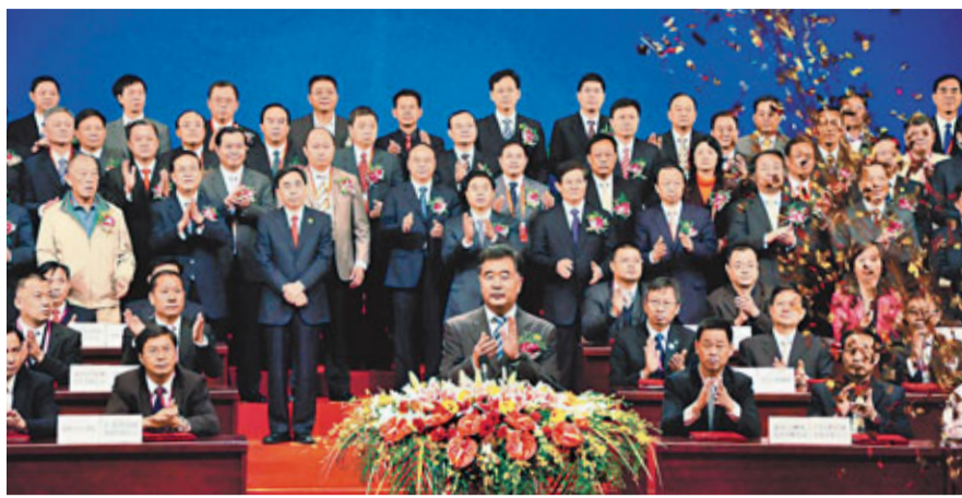
第六屆「山洽會」在汕頭舉行,中為廣東省委書記汪洋宣布開幕。

據悉,本屆山洽會以「市場導向、優勢互補、互惠互利、共贏發展」為原則,圍繞聯手推動「雙轉移」、重點抓好生產、資源、流通、科技、資本、人才勞務等六個領域的合作,39個參展參會分團中既有國有大中型企業,也有民營中小企業;既有工業製造業企業,也有農產品加工業、商貿流通以及房地產、旅遊等其他服務業企業;既有高科技信息產業,也有金融擔保行業。