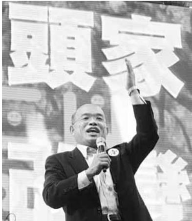
蘇貞昌敗選台北市長，引來綠營黨內非議。圖為蘇競選時，用音樂會代替造勢晚會。

吳乃仁是民進黨主席蔡英文的得力助手，蘇系在民進黨修訂2012「總統」參選人黨內提名辦法前夕，炮打吳乃仁，被視為挑動了黨內最敏感的「蘇蔡關係」，氣氛緊張。