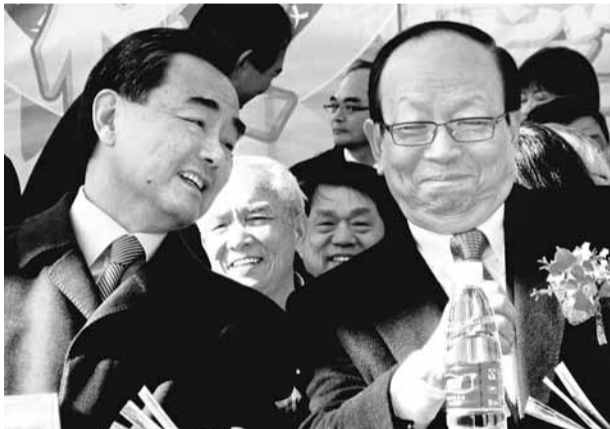
談到兩岸關係，王毅(左)表示應避免受第三方影響。圖為王毅和蔣孝嚴(右)交談。

兩岸良性發展是指相互體諒、相互靠攏、相互釋放善意、相互展示誠意，帶到良性循環軌道，避免把自己意志