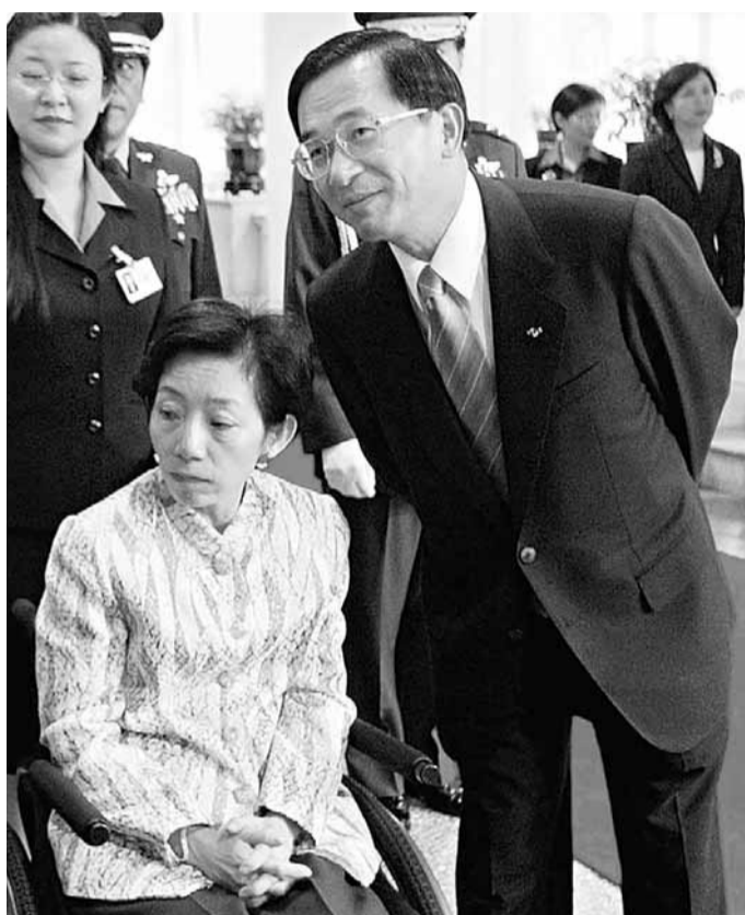
陳水扁及其妻子吳淑珍涉及二次金改案，在法官周占春審理下，2人均脫罪。 資料圖片