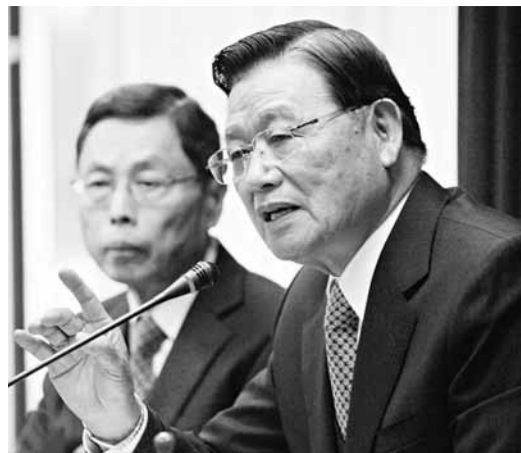
江丙坤表示，2年多來，兩岸兩會協商越來越注重實質，現在進入內容涉及比較廣義的經濟，也是比較困難的階段。

他提到，關於「投資權益保障」議題，各方面都很關切。事實上隨著兩岸經貿關係緊密，台商在大陸投資日益增加，經貿糾紛的案件也逐年攀升，其中關於台商人身安全、土地徵收補償以及投資爭端解決的問題，對台商是很重要的課題，如何有效處理這些問題，亟待兩岸協商解決。