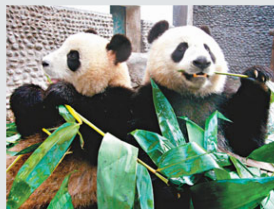
「開開」、「心心」今抵澳,一個月後將可與市民見面。

李業廣則指,在過去3個月,雙方的秘書處一直都緊密聯繫,商定的多個議題,包括香港特區政府在台灣設立綜合性辦事處、香港旅遊發展局在台灣成立正式辦事處、更新兩地空運安排、航運收入避免雙重徵稅、關務交流和文化合作等事宜展開討論,並安排負責處理相關議題的專家會面,從技術及細節層面作深入的磋商,並相信合作成果將會陸續出爐。