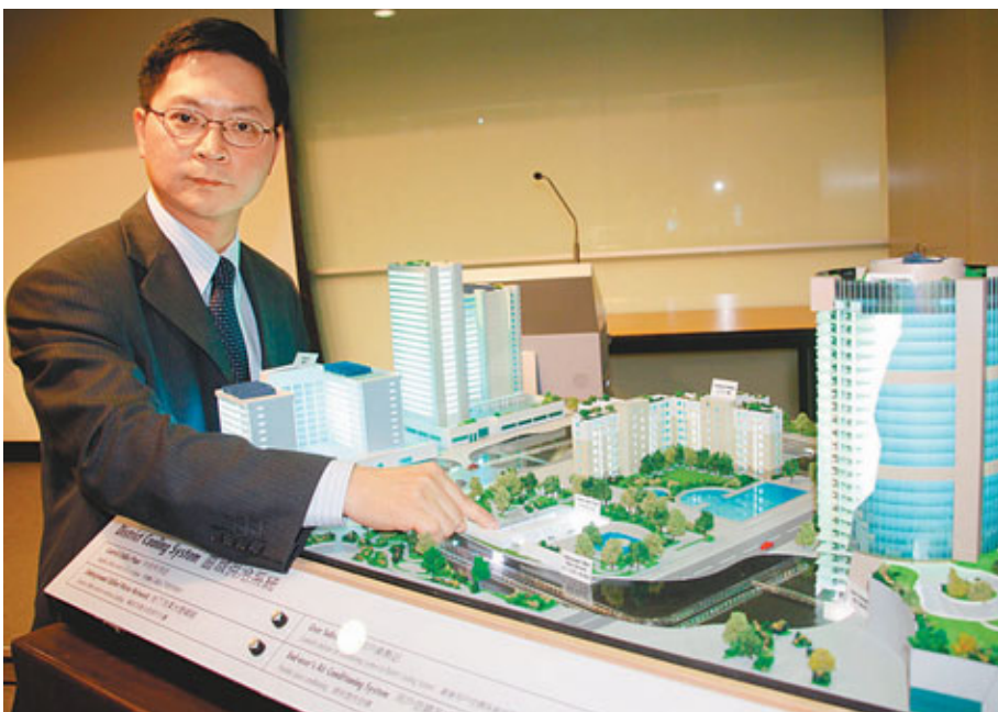
環境局提出在啟德引入區域供冷系統，減少區內公用設施及私人非住宅項目的冷氣使用量。圖為區域供冷系統模型。

當局為使系統收支平衡，除了規定所有公用設施使用有關系統外，還研究在地契中規定，區內私人非住宅項目接駁系統，並以具競爭力收費，吸引用戶使用，料系統於25年內收支平衡。當局初步構思供冷系統的服務收費貼近