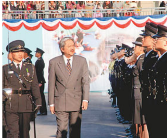
曾俊華(左二)勉勵學員全力以赴，無懼挑戰，秉承懲教署精神，為香港安定作出貢獻。

警方代表接收請願信。及按摩服務後，才表露身份把她拘捕。另外，有性工作者在羈留期間，要求與外界通電被拒，並遭到5、6名警員包圍毆打。衝突期間有女警受傷，警方控告她襲警，被判入獄。紫藤總幹事吳雅嫻要求警方修訂指引，禁止警員在放蛇行動中接受性服務，並向公眾交代放蛇行動所花費的公帑和接受手淫的警員數目，以及成立獨立投訴機制，調查濫權投訴。