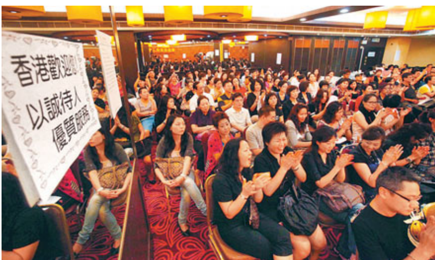
香港導遊總會要求旅議會撤銷「一團一導遊」措施，否則會「先請願遊行、後絕食罷工」。資料圖片

聲稱有1,400名會員的香港導遊總會昨晚召開會員大會，接近200人出席。香港導遊總會會長黃嘉毅表示，如訴求最終不獲旅議會回應，會發起絕食及罷工，預計有600名會員參加。旅遊業議會總幹事董耀中則表示，已決定落實「一團一導遊」，並暫定於明年2月推行。深圳旅遊局也支持有關新措施，旅議會將繼續與香港導遊總會溝通，「最重要是恢復旅客對香港的信心」。他說，倘總會發起罷工，希望他們預早通知旅行社，以便作出相應人手安排。