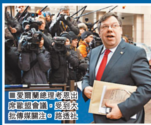
■愛爾蘭總理考恩出席歐盟會議，受到大批傳媒關注。

儘管歐盟和國際貨幣基金組織(IMF)為愛爾蘭提供850億歐元(約8,820億港元)緊急援助方案，但國際評級機構穆迪投資服務公司昨日仍將愛爾蘭的信貸評級由目前的「Aa2」，連降5級至「Baa1」，僅比垃圾評級高3級，評級前景列為「負面」，意味著若該國債務狀況無法穩定下來，將面對評級進一步下調。