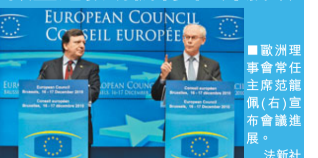
■歐洲理事會常任主席范龍佩(右)宣布會議進展。

歐盟峰會同意建立永久性金融穩定機制，取代將於2013年到期的歐元區緊急救助基金，加上德國商業信心指數升幅超乎預期，刺激歐元兌主要貨幣昨日幾乎全線上升，其中兌日圓報111.38，升0.2%；兌美元曾報1.3255水平，升0.1%，後轉跌，報1.3156美元。歐洲債務危機揮之不去，拖累歐洲股市，倫敦、巴黎和法蘭克福3大指數均報跌。