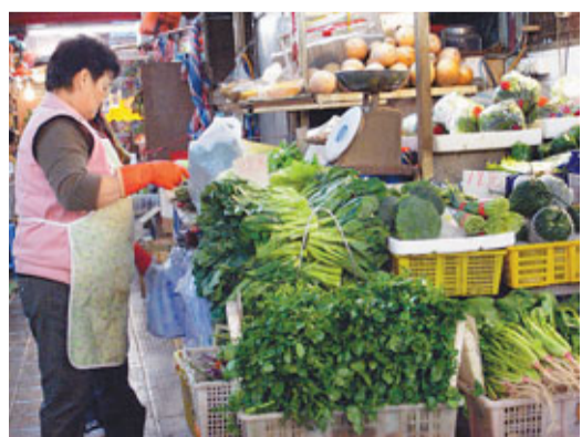
■昨天整體蔬菜零售價上升10%至20%。

香港文匯報訊(記者 陳寶瑤、曾偉龍)寒流襲港，氣溫驟降，蔬菜供應量隨之減少。蔬菜統營處數據顯示，昨日供港蔬菜量下降14%，平均批發價上升10%；零售方面，整體菜價升10%至20%，唐萵由每斤8元升至12元，暴升50%；每斤豆苗售價達56元。雖然天氣有望回暖，但下周三冬至，蔬菜的需求大增，料市民仍要「捱貴菜」一段日子，直至聖誕節前菜價才能回復正常。