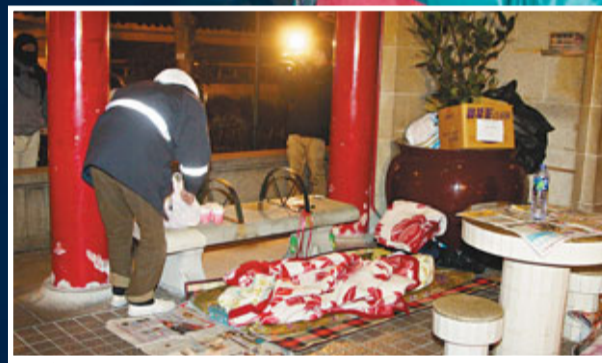
■險被凍死的露宿者遺留在佐治五世公園的被鋪。