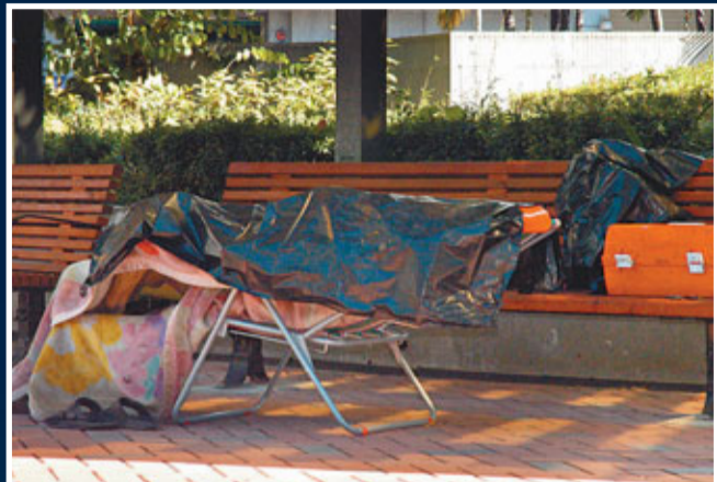
▲海濱道公園疑遭凍死的露宿者遺體，被警員用黑膠袋遮蓋。

香港文匯報訊(記者 蔣焯文、覃少林)香港持續受寒流影響，昨日凌晨市區錄得1999年以來最凍的12月，僅得攝氏5.8度，大帽山更低至零下3度，結霜「奇景」再現，吸引大批市民登山賞霜，惟嚴寒卻令逾百長者及露宿者須與死神搏鬥，5人疑遭凍斃，93人懷疑受凍不適送院。澳門一位愛心婆婆，在無情寒流中盡顯溫情，專程來港為露宿者送被保暖，更揭發露宿油麻地公園的一名七旬翁不敵嚴寒，險遭凍死，愛心婆婆報警救回他一命。