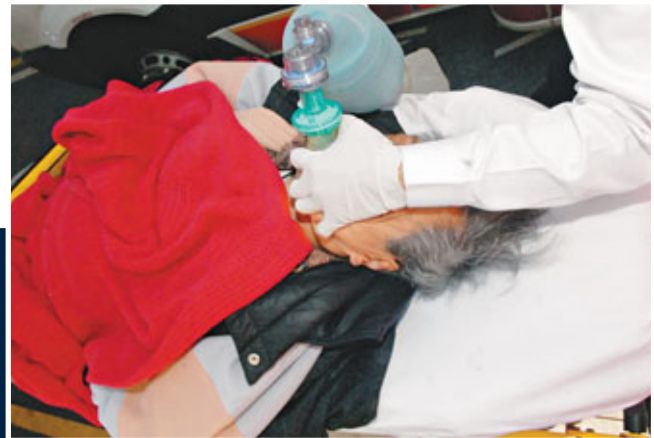
■寒流之下，一名老婦在橫頭磡寓所內昏迷，送院證實死亡。