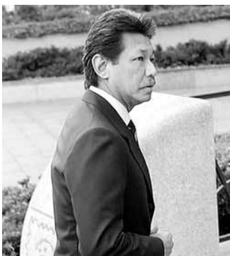
文萊親王傑弗里敗訴。

文萊親王傑弗里涉嫌私吞國家財產，與兄長文萊蘇丹博爾基亞打官司。傑弗里早前控告他僱用的兩名英國律師多次藉職務之便詐騙他的私人財產，但美國紐約法庭前日裁定傑弗里敗訴，兩名律師獲賠共逾2,100萬美元(約1.6億港元)。文萊王室是全球最富有的王室之一，傑弗里亦以妻妾成群、風流倜儻聞名，今次訟戰使外界一窺傑弗里令人咋舌的財富。