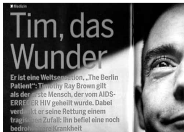
染上愛滋病毒男子成功病癒，有媒體刊出該男子的部分面孔。