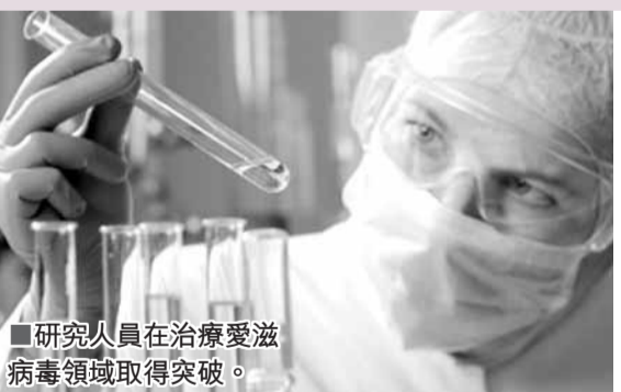
研究員在治療愛滋病毒領域取得突破。

德國研究人員宣稱成功發現全球首個愛滋病毒(HIV)療法，不過醫學界對此看法兩異，有人認為療法風險高費用貴，難以作為愛滋病標準療法；但參與研究的學者認為，未來20年內醫學界將研究出新方法，直接消除患者細胞上的「CCR5」，防止HIV侵入。