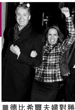
德比希爾夫婦對勝訴判決感到興奮。