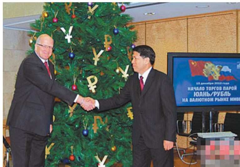
盧布對人民幣掛牌交易15日在俄羅斯莫斯科銀行間外匯交易所正式啟動。圖為中國駐俄大使李輝與俄央行副行長梅利尼科夫握手相慶。

截至當天交易結束時，人民幣對盧布的加權平均匯率為10元人民幣兌換46.3445盧布。