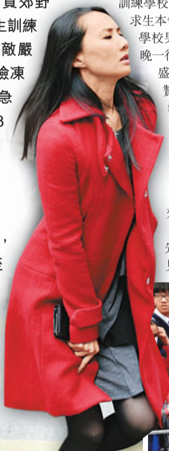
■香港街頭昨日一派冬裝景。

香港文匯報訊(記者 蔣焯文、覃少林)強烈冬季季候風襲港，香港天文台昨晨在市區錄得入冬以來最低氣溫攝氏8.1度，大帽山更僅得零下2度，9名在西貢郊野公園參加野外求生訓練的中學生，疑不敵嚴寒，出現低溫症險凍死，需由直升機急送院救治，其中3人仍須留醫。天文台預計今晨天氣持續寒冷，市區氣溫將降至7度，寒冷天氣持續至周末，下周初氣溫才回升，市民應小心保暖。