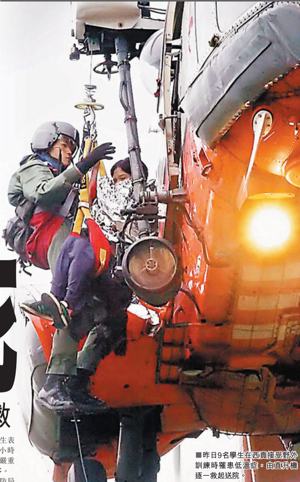
■昨日9名學生在西貢接受野外訓練時罹患低溫症，由直升機逐一救起送院。