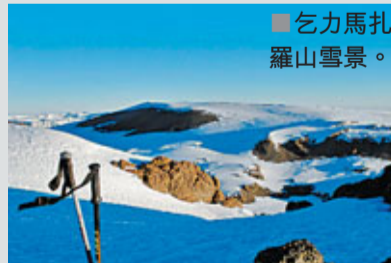
■乞力馬扎羅山雪景。

喜歡攀山挑戰體能的旅友，永安旅遊與兩岸三地旅行社聯手打造「非洲坦桑尼亞15天極致登峰探索之旅」定必能吸引你的注意。