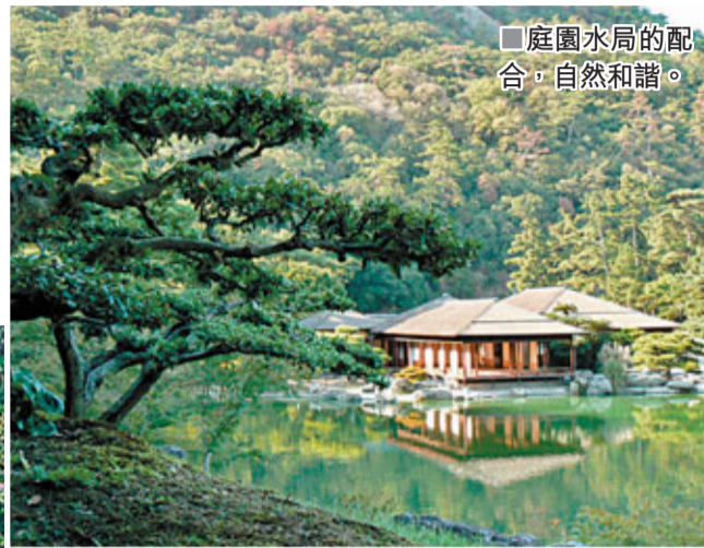
■庭園水局的配合，自然和諧。

贊岐烏冬非常有名，園內亦有贊岐民藝館。民藝館於1907年至1911年間，是日本國內唯一的由縣府管理的民藝館。建築由山本忠司設計，和田邦坊負責內部設計，更有造園學大師中根金作設計現代和