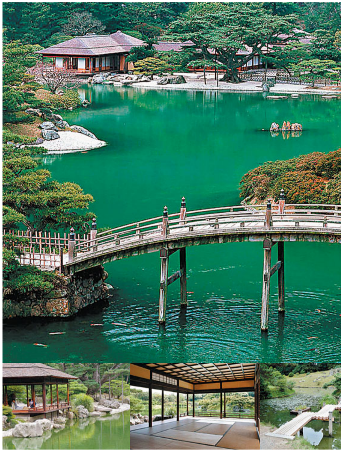
■漫遊古園，或令人重拾古人的閒靜心境。 ■掬月亭是庭園內最大的茶室。 ■栗林公園的木橋。

香川是日本四國近年的旅遊熱點，其中藝術對當地旅遊業影響重大，每年開催的瀨戶內海藝術節吸引世界各地的藝術欣賞者和遊客。不過，看藝術品看膩了，仍可在香川感受四國獨有的自然之美和閒情逸致，還有美味的贊岐烏冬等着遊人。香川並非近年才「冒起」，它一直是重要旅遊點，近年漸趨年輕化，吸引大批年輕遊人。香川縣的優美，並不是愛好時尚的年輕人能體會的，但要是你受夠了大城市的繁華喧囂，在香川可找到傳統大和風情的美食和美景。 文：果林