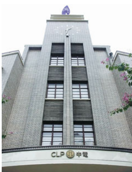
■中電以總代價20.35億澳元收購澳洲電企資產，穆迪認為此舉削弱其財務狀況，擬下調中電評級。

香港文匯報訊（記者 廖毅然）中電控股(0002)就收購澳洲電力資產有突破性發展，集團昨日宣布，旗下全資澳洲能源業務TRUenergy已於周二就收購事項與賣方訂立協議，總代價達20.35億澳元(約155.95億港元)，集團預期將在明年3月1日完成收購事項。收購項目包括EnergyAustralia能源零售業務、Delta Western售電權合約及電廠發展用地。中電表示，收購可令TRUenergy於澳洲的客戶數目增加1.2倍。