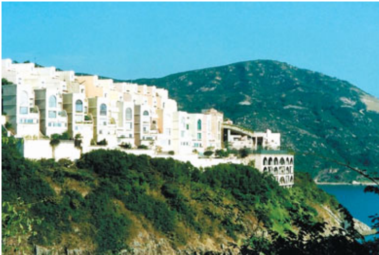
■李錦記家族後人以公司名義斥資1.28億元購入大潭紅山半島，成交呎價創下該豪宅近年新高。