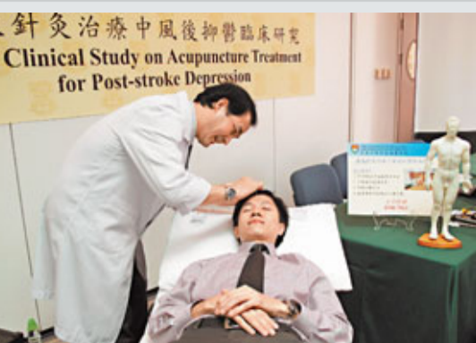
針灸治療中風後抑鬱臨床研究 Clinical Study on Acupuncture Treatment for Post-stroke Depression