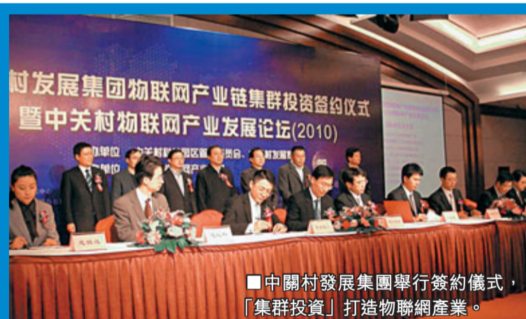
中關村發展集團舉行簽約儀式,「集群投資」打造物聯網產業。

為大力發展物聯網產業,北京中關村發展集團在國內首次以「集群投資」方式,投資近6000萬元,強力打造覆蓋物聯網整條產業鏈的「超級艦隊」。中關村發展集團董事長于軍指出,物聯網用途廣泛,目前已在電力、醫療、城市、交通等領域開始應用,預計未來10至20年,物聯網技術將在各行業大規模應用,形成上萬億元規模的巨大市場。