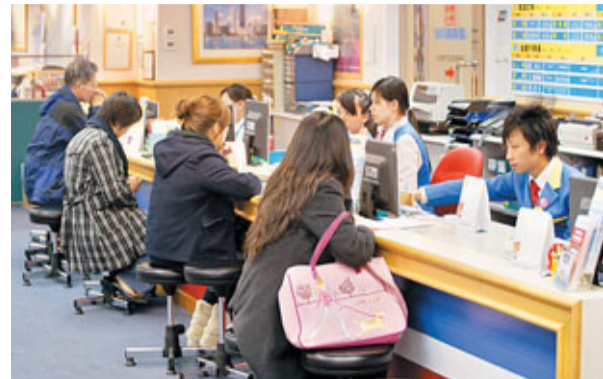
本月首10天,聖誕團客量僅按年微升3%,與全月升20%的預測相差一大截。

管制,要求旅行社如取消廣東省以外、在明年2月2日至6日(即年卅至年初四)出發的旅行團,需在出發前最少14天向顧客退還所有款項,否則需賠償15%團費,以1,000元為上限;旅行社如取消明年2月2日至6日出發的廣東省內旅行團,則最少要在出發前5天向顧客退款,否則同樣需賠償15%團費,以1,000元為上限。