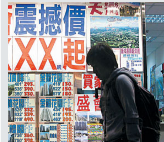
中大亞太研究所的調查顯示,71.5%受訪者贊成政府實施額外印花稅打擊炒樓。

另外,特首曾蔭權昨日下午專程探望了馬尼拉人質事件中的汪氏姊弟和他們的姑媽。曾蔭權說,再次見到兩姊弟,覺得姐姐的笑容多了,弟弟亦長大了不少,他們懂得照顧自己,回復正常生活,令他感到很欣慰。姑媽表示,十分感謝學校校長、老師、社工和警察等有心人過去的幫助。特首囑咐兩姊弟多與人傾訴,要應付高中課程的姐姐更要努力讀書。最後,特首給每人送了一部iPod和聖誕卡,向兩姊弟送上節日祝福。