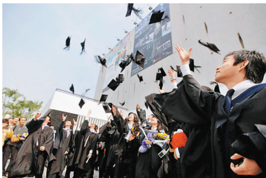
大學聯校就業資料庫最新數據顯示,過去一季供畢業生申請的職位數目達2,750個,較去年同期勁升45%。

香港文匯報訊(記者 歐陽子瑩) 市道好轉,大學生的求職選擇亦增加。大學聯校就業資料庫最新數據顯示,過去一季供畢業生申請的職位數目達2,750個,不單較去年同期上升45%,比起07年金融海嘯前就業前景最為看好的高峰期,職位也多出逾200個,增幅近一成,為歷來該段期間職位最多的1年。薪酬方面,各職位月入中位數亦由去年的9,500元,升至今年的1萬元。有人力資源顧問指,市況反映幾乎所有行業都對前景感樂觀,金融、IT及工程人才更為吃香。