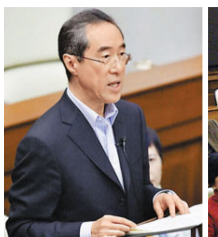
唐英年指特首訓斥俞宗怡是恰當的做法。

香港文匯報訊(記者 鄭治祖) 立法會昨日通過《調查有關梁展文先生離職後從事工作的事宜專責委員會報告》,多位議員於會上促請政府進一步處分公務員事務局局長俞宗怡和相關官員,及懲處梁展文。政務司司長唐英年回應時透露,特首曾蔭權前日已就事件訓斥了俞宗怡,指他在處理有關申請時考慮有不足之處,申令她以後處理同類申請時,一定要更加仔細、全面和審慎。他形容,這是適度和恰當的做法。他又就報告中指審批時沒有考慮公眾觀感問題,離職公務員就業申請諮詢委員會的運作無成效,以及相關的23項改善建議等問題,逐一作出回應。