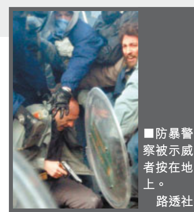
防暴警察被示威者按在地上。