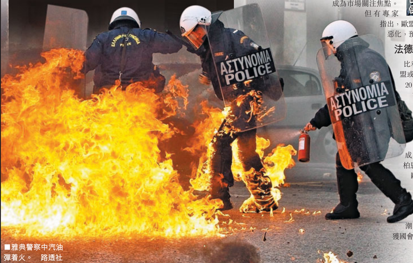
雅典警察中汽油彈着火。