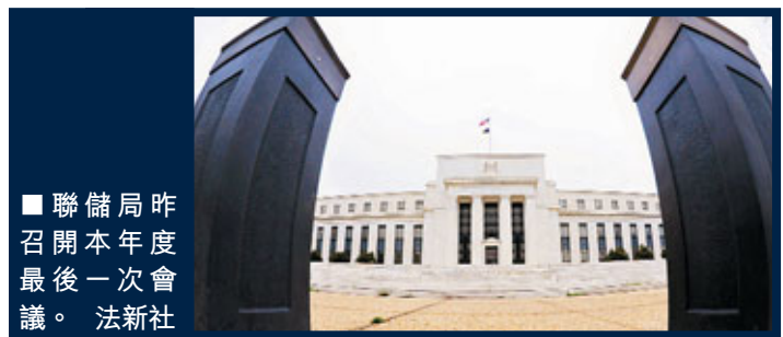
聯儲局昨召開本年度最後一次會議。