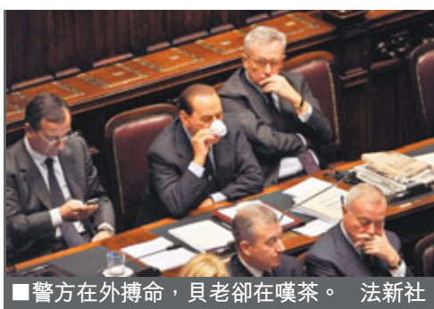
警方在外博命，貝老卻在嘆茶。

意大利總理貝盧斯科尼昨日避過反對派提出的不信任動議，引發羅馬掀起反貝老示威，並演變成衝突，超過100人受傷，當地報章《晚郵報》形容為羅馬超過30年以來最嚴重騷亂。