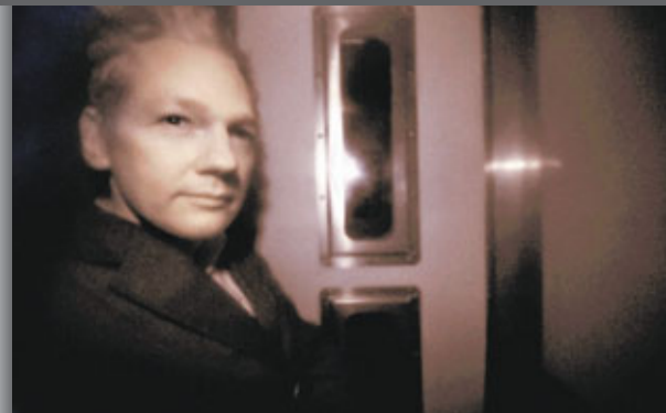
■阿桑奇昨乘警車前往法院出席引渡聆訊。