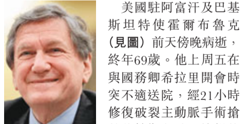
美國駐阿富汗及巴基斯坦特使霍爾布魯克(見圖)前天傍晚病逝，終年69歲。他上周五在與國務卿希拉里開會時突不適送院，經21小時修復破裂主動脈手術搶救後轉為危殆。據報他在手術前留下遺言：「要結束阿富汗戰爭。」在霍爾布魯克近50年的從政生涯中，最大成就是1995年促成波斯尼亞內戰結束。總統