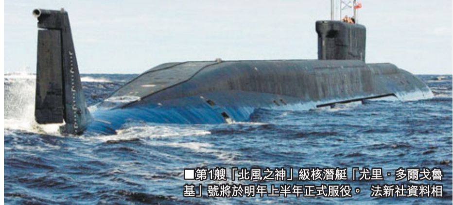
■第1艘「北風之神」級核潛艇「尤里·多爾戈魯基」號將於明年上半年正式服役。