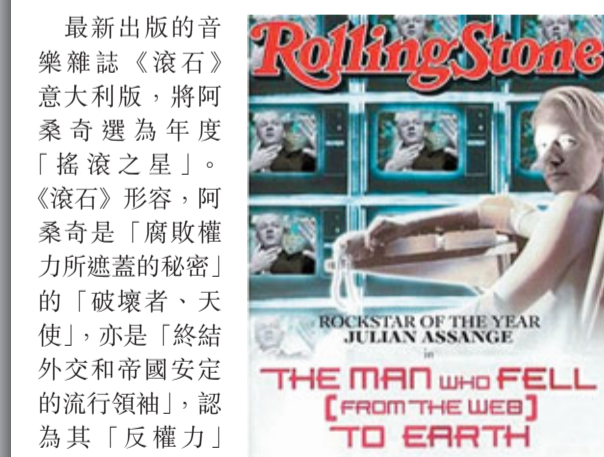
最新出版的音樂雜誌《滾石》意大利版，將阿桑奇選為年度「搖滾之星」。《滾石》形容，阿桑奇是「腐敗權力所遮蓋的祕密」的「破壞者、天使」，亦是「終結外交和帝國安定的流行領袖」，認為其「反權力」形象與搖滾十分相符。該刊亦將刊登維基解密核心成員的專訪特輯。該刊去年也曾將意大利總理盧斯科尼等非樂壇人士，選為年度「搖滾之星」。■共同社