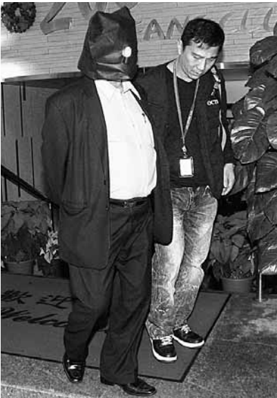
被捕者包括一名衣着光鮮男子。