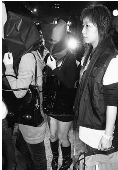
「O記」反黑行動拘捕多名女子。