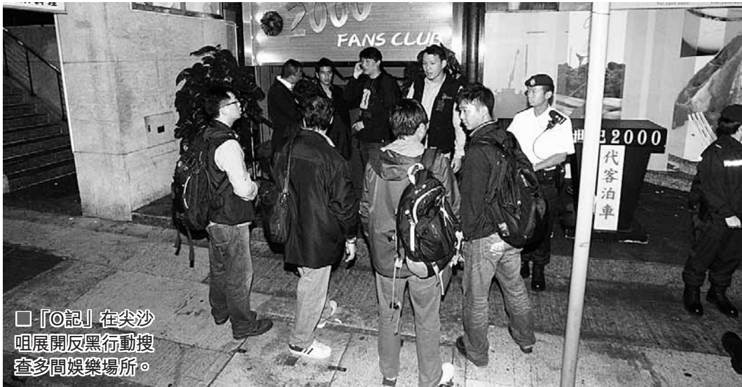
「O記」在尖沙咀展開反黑行動搜查多間娛樂場所。

行動中警方又搜查全港多個地點,再拘捕5名男子,其中在九龍城被捕的一名56歲姓林男子,相信屬黑幫集團主腦人物。警方又派緝毒警犬到場協助,搜查疑犯的私家車,惟未有發現。