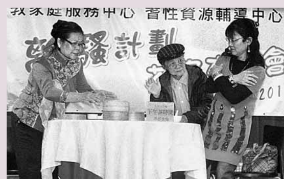
團體以短劇帶出長者間會發生的性騷擾情景,教導長者何謂性騷擾,以免墮入其中而不自知。