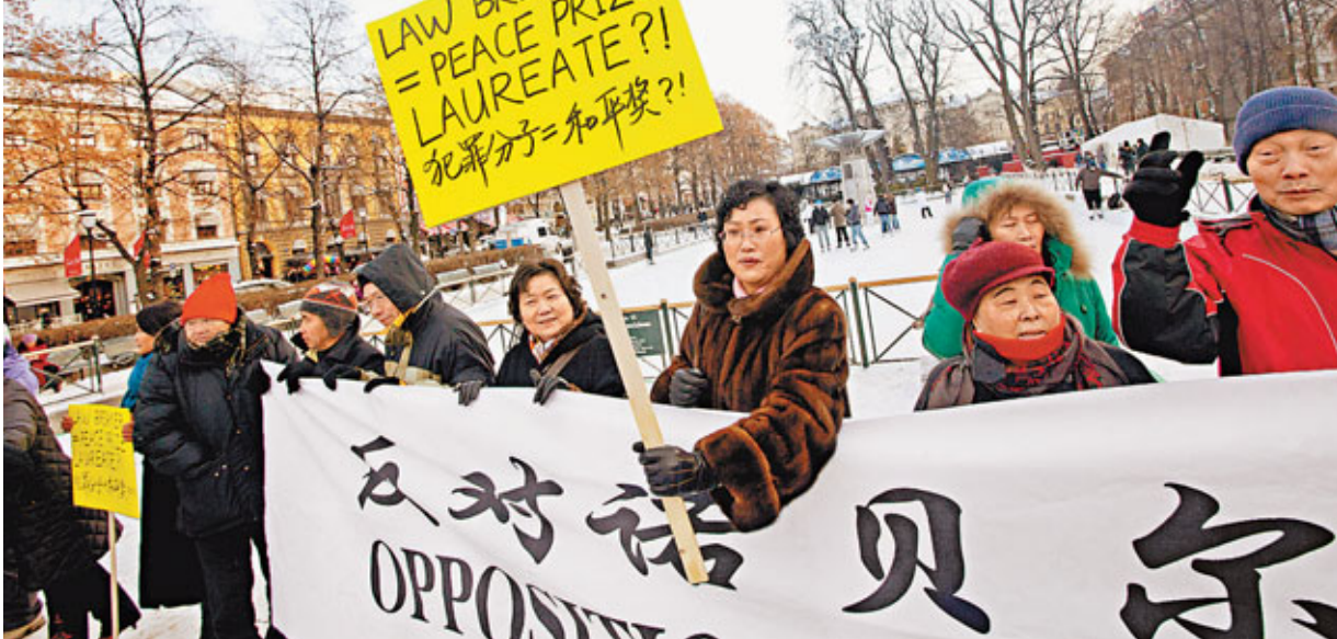
■今年諾貝爾和平獎頒授予劉曉波，背後有政治動機。圖為挪威當地華人華僑在諾貝爾和平獎頒獎當天打出標語，反對諾委會的決定。