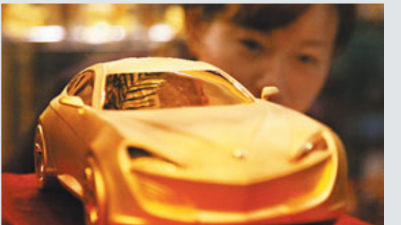
黃金跑車 近日，南京寶慶銀樓店內出現一輛「黃金跑車」，這輛用5公斤足金打造的「黃金跑車」由4名金匠歷時4個多月時間手工打造完工，價值300多萬元人民幣。圖為「黃金跑車」吸引了一位女士的目光。

小區物業李經理承認3幢住宅樓在河道拓寬開挖後出現開裂等問題。他表示，河道施工方着手修補，但被小區居民拒絕，居民提出首先調查清楚開裂及傾斜的原因。據悉，經過宜嘉苑小區居民與河道施工方的交涉，目前施工處於暫停狀態。