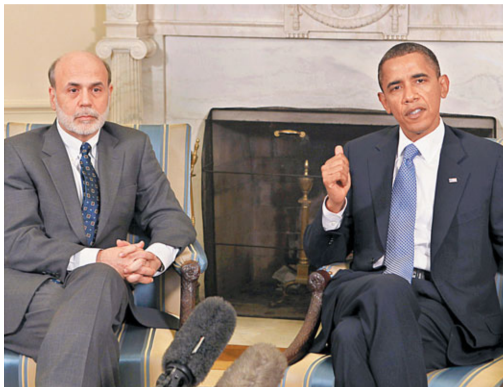
奧巴馬政府的減稅方案增大財赤風險，穆迪警告可能將下調美國信貸評級。圖為聯儲局主席伯南克(左)與奧巴馬會面。