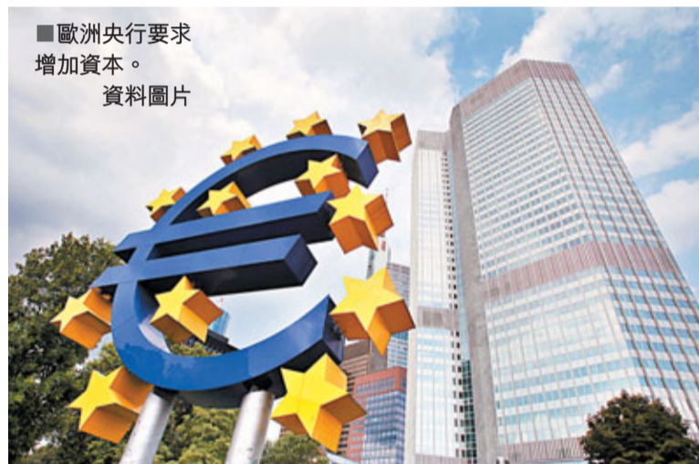
歐洲央行要求增加資本。

共和黨重掌眾院 伯南克難作為 美國聯邦儲備局主席伯南克上月宣布推出第二輪量寬鬆政策後，批評聲音一浪接一浪。對伯南克更不妙的是，由共和黨控制的新一屆眾議院即將在下月就職，共和黨議員已醞釀推出針對聯儲局的連串監察甚至制權措施，伯南克肯定受到更大掣肘。 美國經濟復甦呆滯，失業率持續高企，聯儲局早已成為箭靶。伯南克決定加碼6,000億美元購買債券，更是火上加油，引發華盛頓30年來最猛烈的反彈。量寬的目標是推低息率和刺激增長，然而從10年期國庫券息率過去一個月由2.57厘升至3.28厘，反映迄今效果不對。 美國經濟表現未見改善，伯南克面對的政治壓力越來越沉重。新一屆眾議院即將上場，一直主張擴張聯儲局的共和黨議員保羅，將領導監察聯儲局的委員會；眾院監管和政府改革委員會主席則由伊薩擔任，他表明希望聯儲局對公眾更負責任。 部分共和黨議員也建議嚴加制約聯儲局，包括削掉治理通脹以外的職責，以及縮短公開會議紀要的5年期限等。外來的壓力更引發連鎖效應，令聯儲局內部反對局方政策的聲音增加，形成內外夾擊的局面。 聯儲局一向被視為政治獨立、無黨派的機構，不過在目前環境下，政治免疫已變得不可思議。有經濟學家形容伯南克會發現自己身處洞中，「越往下挖只會越陷越深，最終被迫停止行動」。 ■霍尊