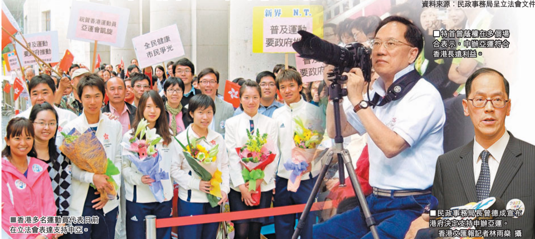
香港多名運動員代表日前在立法會表達支持申辦。

香港申辦亦有無形效益。民政事務局長曾德成曾強調,申辦應視為「機不可失」,將該筆開支視為投資,來推動香港的體育發展及提升港人健康,確立香港作為亞洲「世界城市」的地位,而這些無形效益並非金錢能夠衡量。