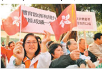
本港多個團體支持申辦亞運。

香港文匯報訊(記者 鄭治祖)特區政府決定香港申辦2023年亞運會,其實早於本月初公布公眾諮詢報告時已露端倪。該諮詢報告的結果顯示,在諮詢期內提交意見的市民中,68.8%贊成香港申辦,29.6%不贊成;84%提交意見的團體支持香港申辦,11%表示不贊成。同時,根據當局委託中大進行的民調顯示,58%受訪者認同主辦亞運會可推動香港的體育發展,56%受訪者認為香港有能力成功主辦亞運會,而在諮詢期末的調查亦顯示,48.2%受訪者支持香港申辦,略多於不支持的47.2%。