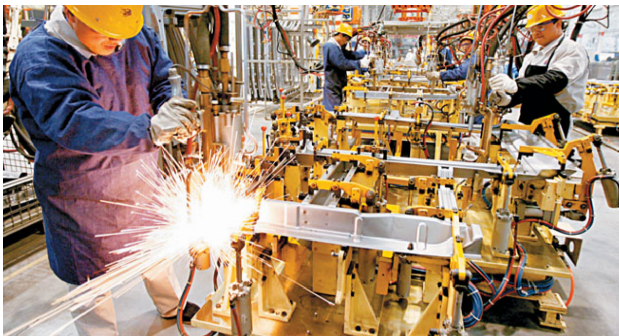
全國人大財經委副主任委員賀鏗(見小圖)預期，2011年中國經濟或將面臨二次探底。圖為內地某汽車製造廠的車間工人在焊接車廂。

理，具體包括，一是加大對能夠容納更多就業的新興產業扶持力度。二是加強技術培訓，三是深化財政稅收工資制度的改革，優化組合生產要素，利用工資制度、稅收、財政制度的改革，把資金、人才引導到需要發展的地區和行業。