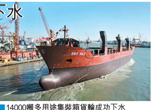
14000噸多用途集裝箱貨輪成功下水

面對眾多挑剔的船東，天津新港船舶重工始終以造船總裝化、管理精細化、信息集成化為目標，牢牢把握住造船質量，廣攬訂單，擴大生產，贏得眾多國際用戶的青睞。