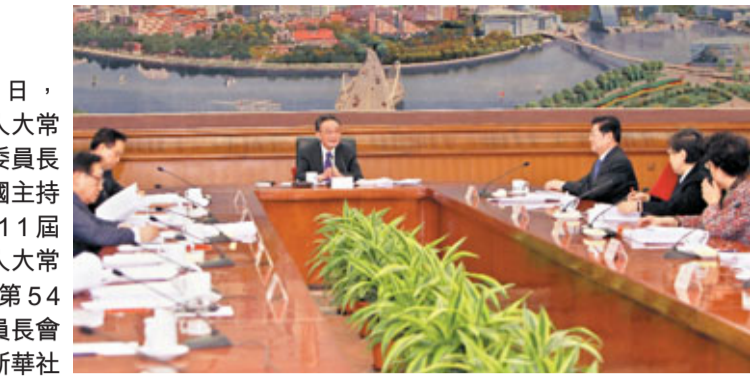
13日，全國人大常委會委員長吳邦國主持召開11屆全國人大常委會第54次委員會議。

香港文匯報訊(記者 劉凝哲 北京報導) 11屆全國人大常委會第54次委員會議昨日在北京召開，會議決定11屆常委會第18次會議將於20日至25日在北京舉行。值得關注的是，下周即將召開的常委會會議，將審議「關於召開第11屆全國人民代表大會第4次會議的決議」，這意味着2011年全國「兩會」召開的時間、主要議程將在此次常委會會議上得以確定。另據了解，備受關注的中國「十二五」規劃綱要預計將提交全國「兩會」審議。全國人大常委會委員長吳邦國昨日主持召開的委員會議決定，常委會第18次會議將繼續審議水土