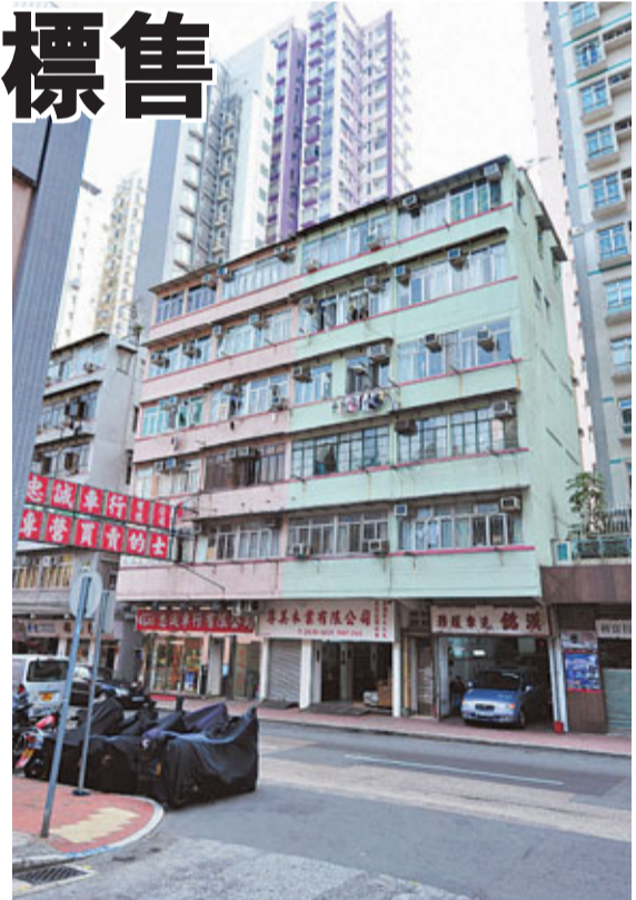
■何文田高山道18至24號唐樓逾9成業權招標。

他預期,物業收樓、動工興建至落成,需時約4年左右,剛好配合上述路段通車,加上物業對面為高山劇場,坐擁高山道公園的開揚綠化景致,預料在市區單位罕有供應下,物業重建為豪華精品式住宅,料甚具市場潛力。