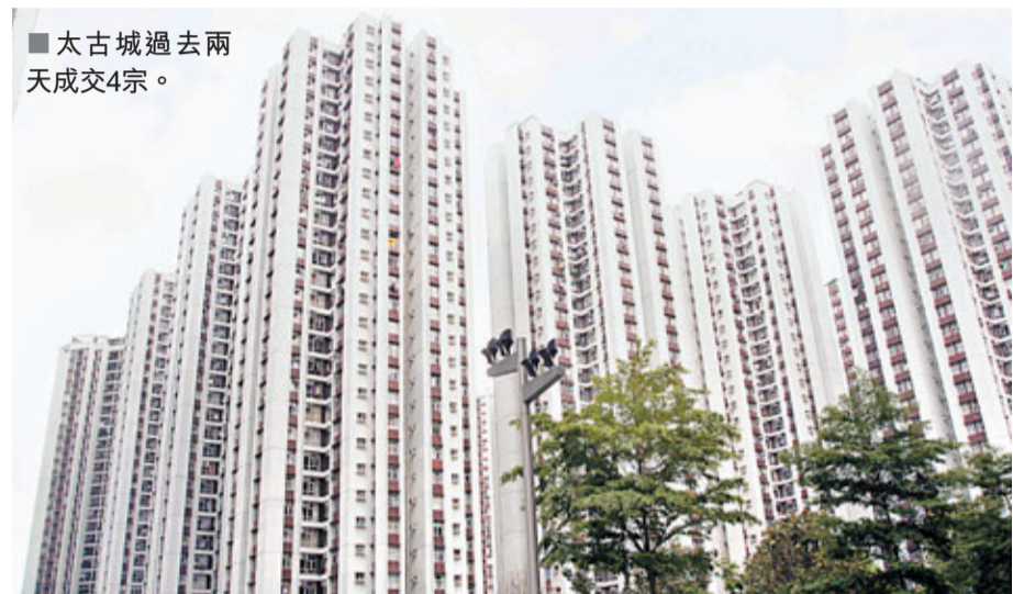
■太古城過去兩天成交4宗。

香港置業文啟光表示,碧海藍天5座中層E室,建築面積679平方呎,2房間隔,享維港海景,以393萬元成交價計算,呎價約5,788元。買家為區內用家。單位原開價430萬元,買家還價後,前後獲減價約8%,終以「筍價」393萬元成交,較市價平約5%。據悉,原業主於08年2月以355萬元購入,是次轉售獲利38萬元,物業升值11%。