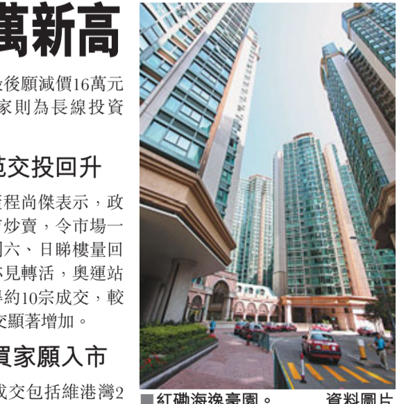
■紅磡海逸豪園。 資料圖片

他續稱,經過數周拉鋸後,買家不再期望放盤出現大幅割價。部分業主願意提供3-5%議價空間,即有