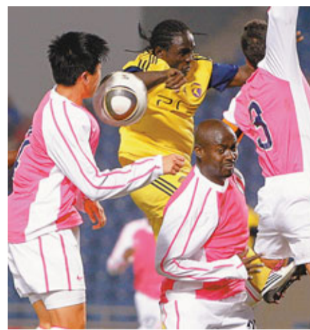
晨曦門前大混戰。

下半場飛馬先後換入李康廉及李靈峰企圖加強攻勢,不過晨曦打出信心下反擊更為銳利,卡爾於60分鐘個人表演近門射入宣告梅開二度,及後備入替的凌琮更改寫紀錄至4:0,令飛馬吞下今季最大敗仗。