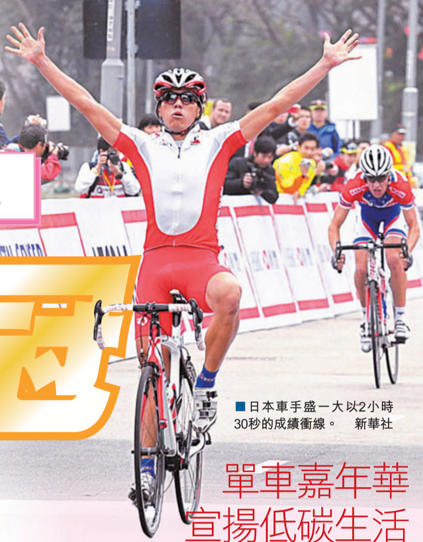
日本車手盛一大以2小時30秒的成績衝線。